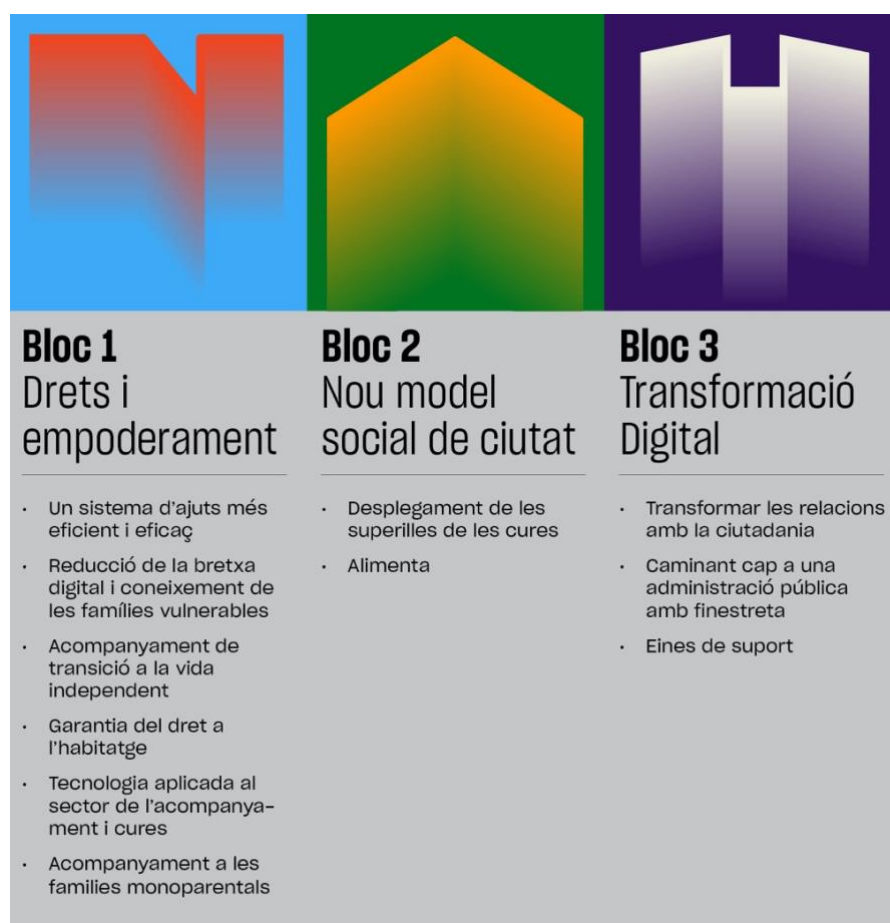
Figura 2. Blocs i actuacions principals de la mesura de govern

Per tal de fer més entenedora la descripció de les actuacions, a continuació s'aporta una infografia (Figura 2) i una taula (Taula 1) que mostren respectivament, graficades i desagregades, les principals actuacions de cada bloc de la mesura de govern. A l'apartat 3.4.1, es fa una descripció detallada de totes les actuacions.