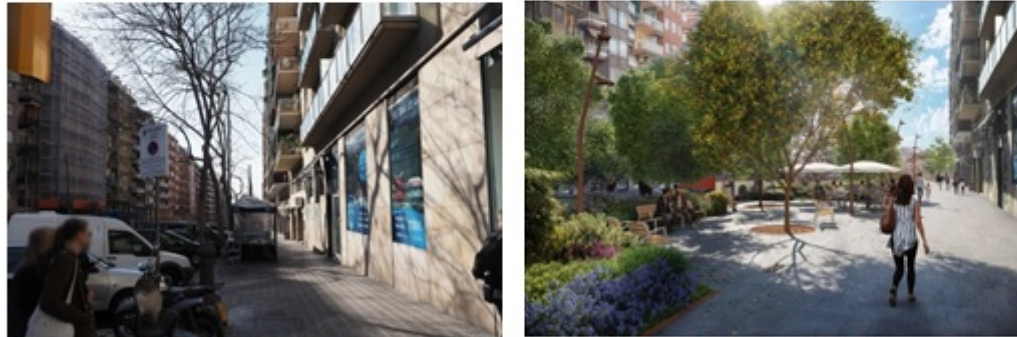
Comparativa entre l'estat actual del tram entre els carrers Encarnació i Sant Lluís i la recreació de la futura plaça que es crearà en aquest àmbit.

En aquestes places i també al llarg de tot el carrer es col·locaran 42 bancs i 121 cadires. I per millorar la transversalitat i la comunicació entre barris, s'augmentarà de 8 a 14 el número de passos de vianants –un d'ells, al carrer de l'Escorial, a l'àmbit de Joanic.