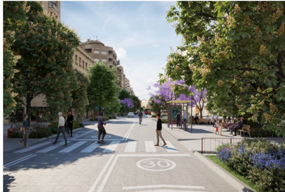
Recreació de la futura secció de Pi i Margall.