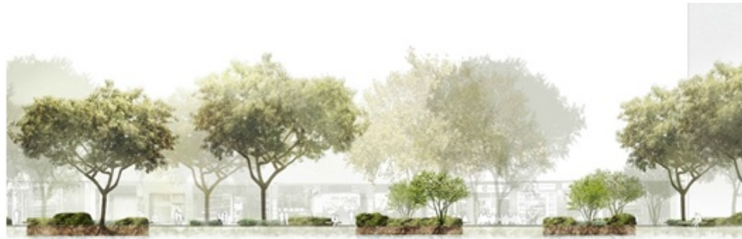
Futura disposició de l'arbrat i els arbusts.

Un altre dels punts destacats del futur eix de Pi i Margall serà el foment de la vida de barri i el comerç de proximitat. Per això, es crearan quatre noves places que ocuparan en conjunt més de 2.800 m2. Se situaran a l'àmbit de la plaça de Joanic; al de l'encreuament amb els carrers de Sant Lluís i de Ca l'Alegre de Dalt; al dels carrers de l'Encarnació i de Pau Alsina, i al dels carrers de Sardenya i de la Providència.