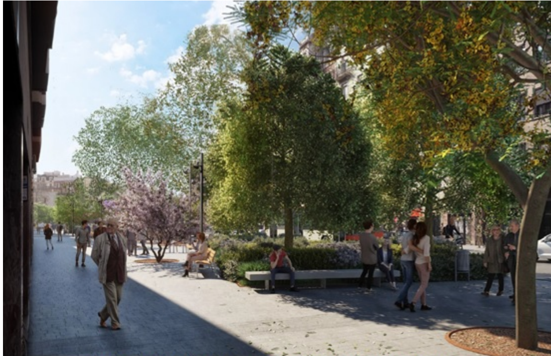
Recreació de la remodelació de Pi i Margall al tram Joaquim Ruyra-Plaça Joanic.

Aquest és un exemple paradigmàtic de com l'asfalt està donant pas al verd a la ciutat. Actualment, 20 dels 30 metres de l'ample del carrer són de calçada, amb dos carrils de circulació, dos de bus-taxi i dos d'aparcaments i serveis. La nova secció capgirarà del tot aquesta situació: es passarà de destinar dues terceres parts del carrer als vehicles a que el 70% de tot l'espai sigui per als vianants i el verd.