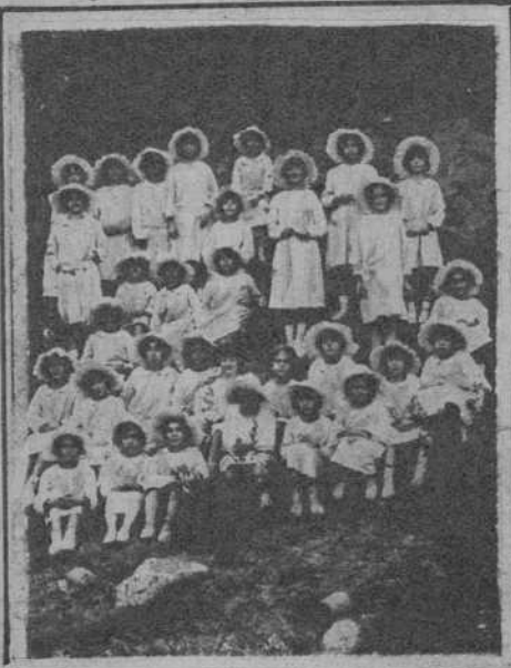
San Esteban de Palautordera.—La Colonia escolar de la Caja de Ahorros de Mataró, que a sus espensas ha veraneado en el internado de las M.M. Felpensas.