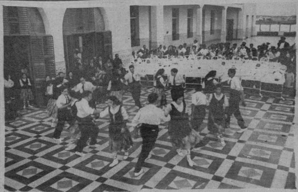
Un momento de la danza «Bolanguera»