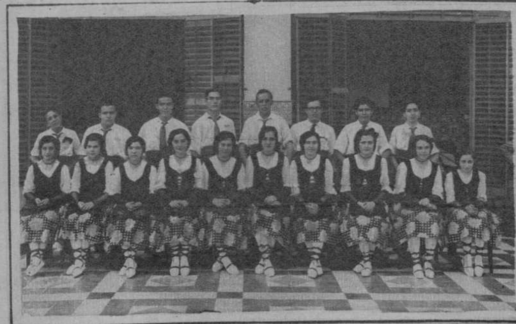
Distinguidos jóvenes de Arbós del Panadés, que forman el «Esbart Dançaire», los cuales ejecutaron diferentes danzas, durante la fiesta