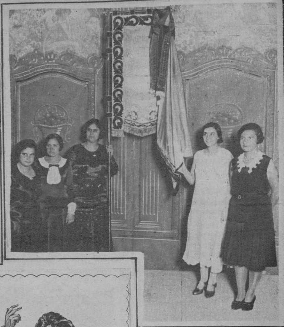
Comisión de señoritas con el nuevo estandarte.