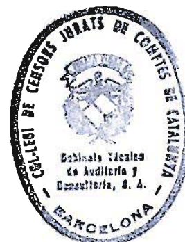
Isabel Balliu i Badia