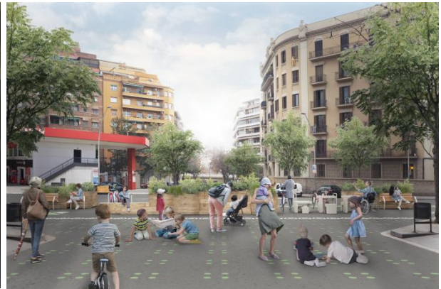
A l'esquerra, recreació de l'entorn de La Salle Horta, amb la pacificació del carrer Letamendi (Horta-Guinardó); a la dreta, entorn de l'Escola Octavio Paz, amb la pacificació del carrer de Biscaia (Sant Andreu).