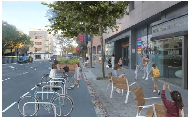
Dos futurs entorns escolars amb ampliació de vorera: a l'esquerra, l'Escola La Sedeta (Gràcia), i a la dreta, l'Escola Pare Manyanet (les Corts).