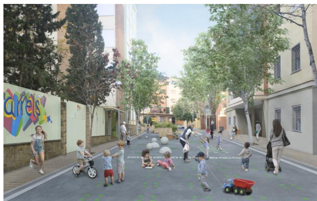
Recreació de l'entorn de l'Escola Arrels, amb la pacificació del carrer de Can Ros (Sant Andreu).