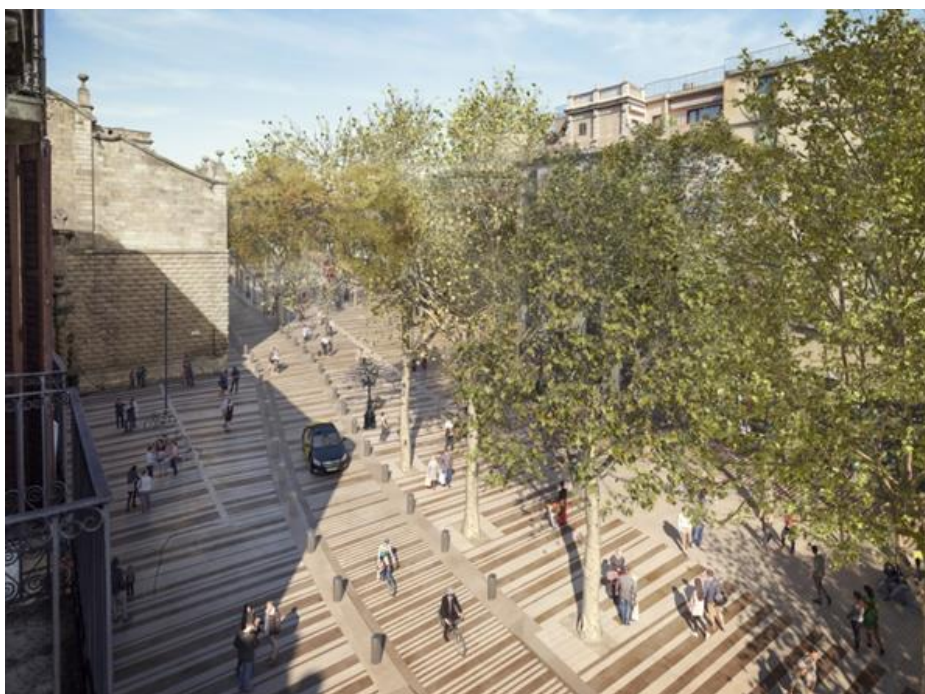
Imatge aèria de la futura Rambla a l'altura del Palau de la Virreina.

A més, s'ha tingut en compte tota la resta d'elements que se situen a la Rambla i que cal ordenar per garantir-ne una distribució coherent i ben relacionada amb els usos del passeig.