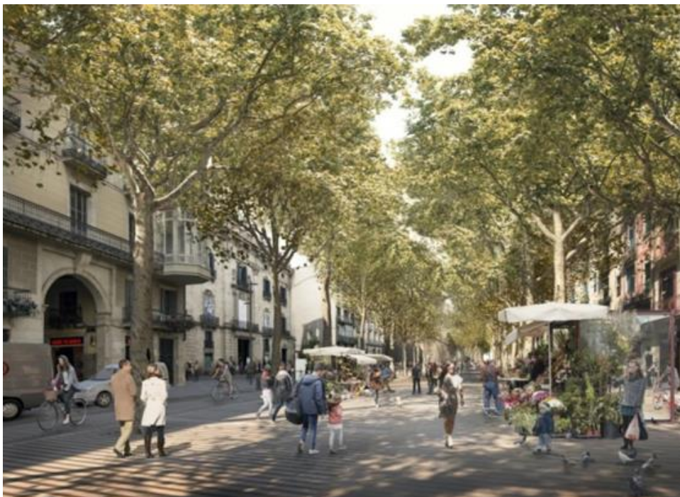
Simulació de la futura Rambla a l'altura del Palau de la Virreina.

El de Colom-Santa Madrona és el primer dels cinc àmbits previstos en la transformació de la Rambla. Els altres s'executaran més endavant, un cop acabat el primer, i són: Santa Madrona-Arc del Teatre, Arc del Teatre-Liceu, Liceu-Portaferrissa i Portaferrissa-Canaletes. El pressupost total del projecte és de 44,56 milions d'euros.