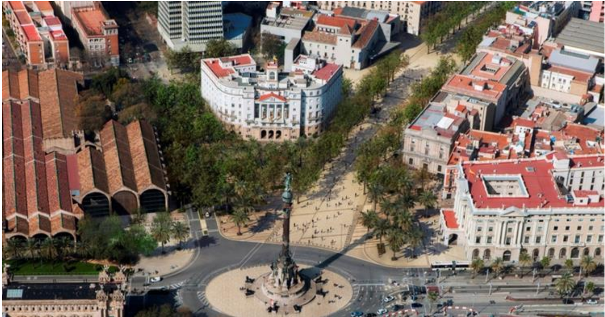
Recreació de la futura Rambla a l'altura de Colom, per on s'iniciarà la reforma

El canvi que es viurà en aquesta part de la Rambla serà molt important. En total, s'actuarà sobre uns 23.000m 2 . Es modificarà el traçat de l'avinguda de les Drassanes per millorar la connexió amb el litoral i allargar la Rambla amb un nou espai urbà d'arribada al front de mar. Així, es crearà una nova plaça amb arbrat que incentivarà els usos socials i renovarà la trobada entre el passeig, les Drassanes i Colom.