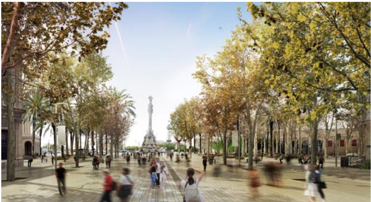
Simulació de la reforma a l'altura de les Drassanes.

El canvi que es viurà en aquesta part de la Rambla serà molt important. En total, s'actuarà sobre uns 23.000m 2 . Es modificarà el traçat de l'avinguda de les Drassanes per millorar la connexió amb el litoral i allargar la Rambla amb un nou espai urbà d'arribada al front de mar. Així, es crearà una nova plaça amb arbrat que incentivarà els usos socials i renovarà la trobada entre el passeig, les Drassanes i Colom.