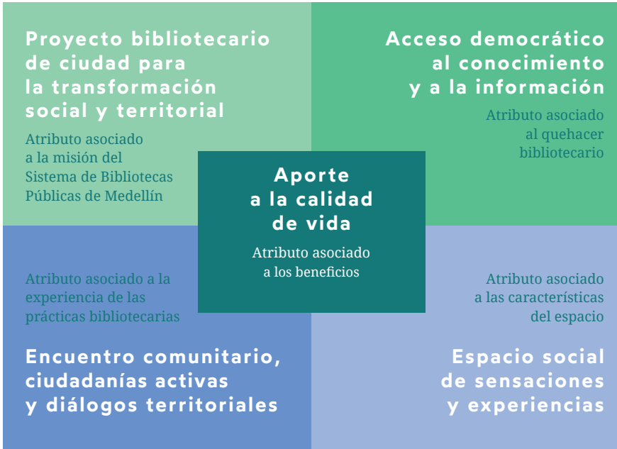
Figura 2. Matriz de dimensiones del valor social del Sistema de Bibliotecas Públicas de Medellín