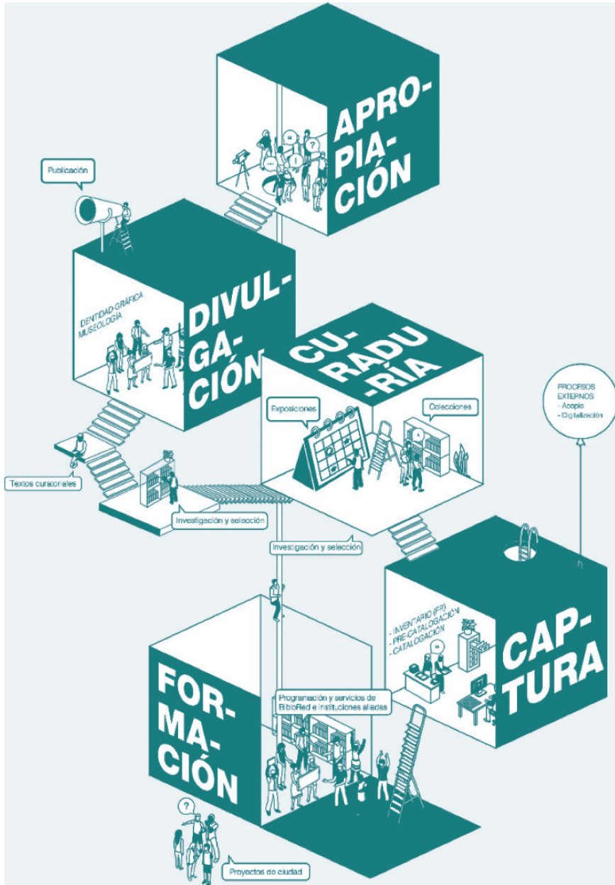
Infografía de flujo de proyectos digitales en BiblioRed (2019).