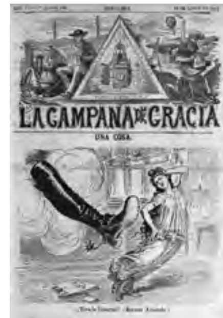
Caricatura que representa el cop d'estat del general Manuel Pavía, que expulsa l'Assemblea Nacional (o la República) de la seu de la sobirania nacional. A terra, les taules de la llei i la reivindicació de la llibertat. La Campana de Gràcia , 18/1/1874, núm. 199, p. 1.

que ens ha arribat als nostres dies. En els darrers temps la historiografia s'ha tornat a interessar pel federalisme dels anys del Sexenni Democràtic. Les anàlisis s'han fet des de la perspectiva de la història política, intel·lectual i constitucional. Així, s'ha volgut subratllar les diferències entre les idees de Francesc Pi i Margall i la seva acció de govern. El pensament de Pi i Margall ha servit per explicar com una part del federalisme havia passat de la fascinació i mística del poble que tenien els jacobins durant la Revolució Francesa al desvetllament del pacte a partir de l'individu sobirà que s'associa al municipi, i d'aquí a la província, la nació i la humanitat. Les propostes de Pi i Margall projectaven un model de democràcia radical en què les aspiracions populars, les associacions obreres i les cooperatives es convertien en un instrument per combatre els principis de l'economia política i del lliurecanvisme plantejats per la democràcia liberal.