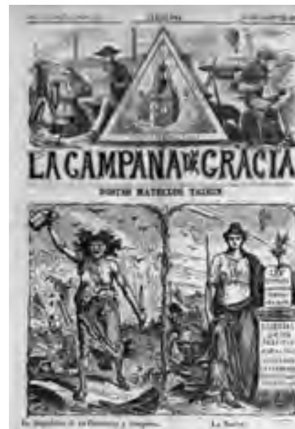
Caricatura per contraposar la República dels cantonalistes, encapçalats pel general Juan Contreras San Román, que lidera la defensa del cantó de Cartagena, i la República Federal que encapçala el govern presidit per Nicolás Salmerón. La Campana de Gràcia , 10/8/1873, núm. 175, p. 1.

L'estudi del federalisme ha estat un dels punts cabdals de la història de la Primera República ja que s'ha associat sovint a conflictivitat, disgregació i fragmentació de la unitat nacional. El federalisme dels republicans és quelcom més divers i plural que la imatge