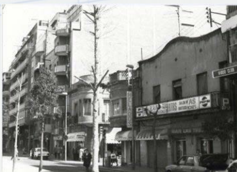
Bar Las Tres Puertas. 1985. AMDNB

Al carrer de Joaquim Valls, cantonada amb via Júlia, hi ha dues casetes d'abans de la Guerra Civil, amb moltes obertures, motlures i tribuna. Una d'elles, pujant a la dreta, té decoració modernista a la part superior. A la banda esquerra hi ha la botiga de roba 10h30 que ocupa el lloc on hi havia el bar Las Tres Puertas, un bar que va ser la seu de l'Ateneu Popular, artístic i cultural, el primer centre social del barri.