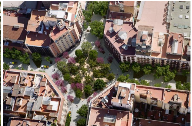
La plaça de Rocafort: recreació a peu de carrer i aèria.