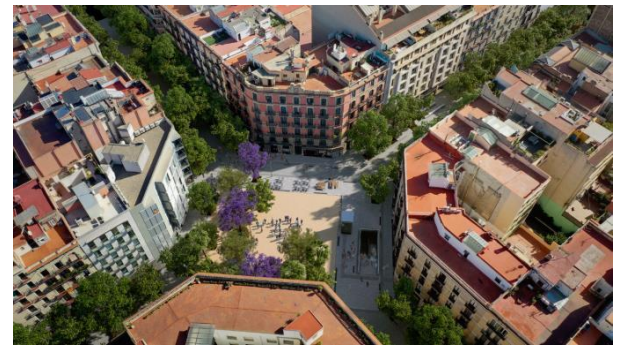
La plaça de Girona: recreació a peu de carrer i aèria.