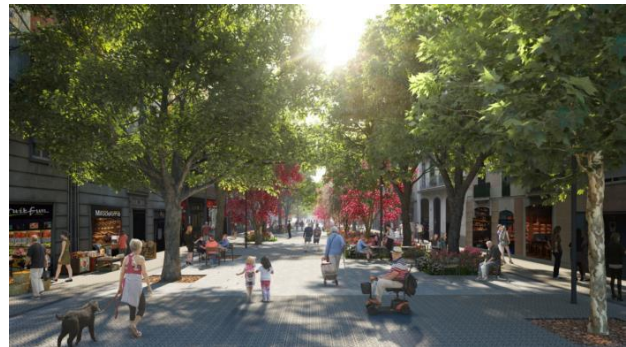
Recreacions virtuals de com seran els quatre primers eixos verds: Consell de Cent (a dalt a l'esquerre), Girona (a dalt a la dreta), Rocafort (a baix a l'esquerre) i Comte Borrell (a baix a la dreta).

Pel que fa a les places, singularitzen cadascun dels quatre espais i pauten els itineraris que es crearan amb els nous eixos verds. A grans trets, hi ha dues tipologies de places. Les dels encreuaments de Consell de Cent amb Comte Borrell i Girona plantegen una idea de plaça més cívica, un espai més neutre i flexible. I les corresponents a les cruïlles de Rocafort i Enric Granados aposten per un espai molt semblant a un jardí on es potenciïn les activitats d'estada i el verd pugui explotar d'una manera més explícita i evident.