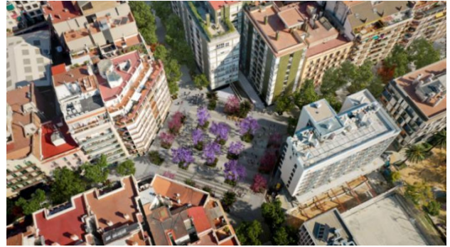
La plaça de Comte Borrell: recreació a peu de carrer i aèria.