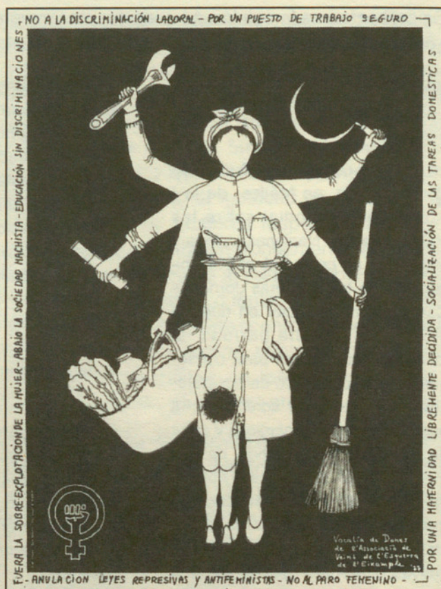
Vocalía de Dones de l'Associació de Veïns de l'Eixample, 1977

años, atribuirá la facultad de decidir al padre o la madre.