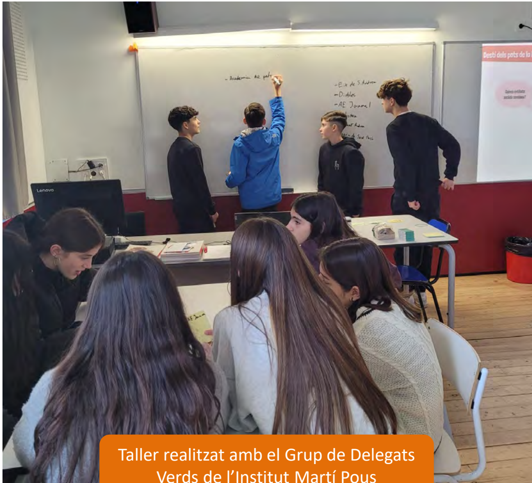
Taller realitzat amb el Grup de Delegats Verds de l'Institut Martí Pous