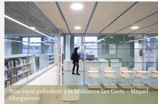
Nou espai polivalent a la biblioteca Les Corts – Miquel Llonguerras