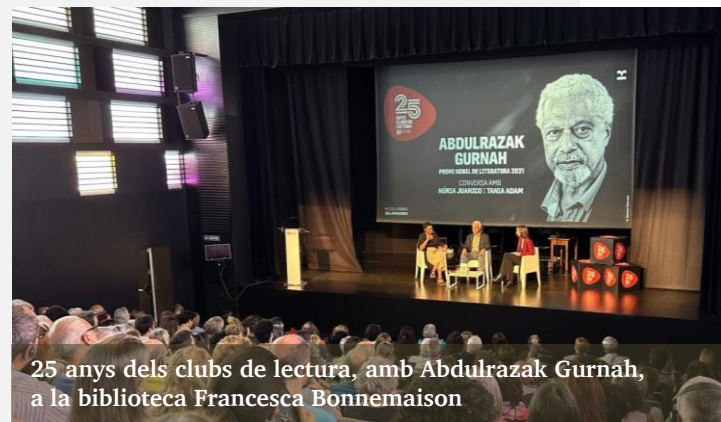
25 anys dels clubs de lectura, amb Abdulrazak Gurnah, a la biblioteca Francesca Bonnemaison

L'actual proposta ofereix clubs especialitzats en temàtiques i gèneres literaris diversos; clubs de lectura que duren tot un curs o clubs puntuals que poden tenir entre una i quatre sessions; clubs de lectura virtuals per comentar les lectures a través d'un xat; clubs de lectura per a totes les edats: per a persones adultes, per a famílies amb infants de 2 a 4 anys, per a nens i nenes a partir set anys i per a joves.