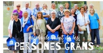
Escola de Salut de les Persones Grans Sant Gervasi - la Bonanova i el Putxet

També és fruit d'aquesta col·laboració amb la taula de salut l'activitat Vides de conte , que consisteix en un taller conduït per la Gina Clotet que es fa en l'itinerari que proposa l'Escola de Salut de les Persones Grans. En aquest taller es parla de les característiques del gènere biogràfic, es fa prescripció de lectures i es donen algunes eines per fer la nostra biografia més atractiva.