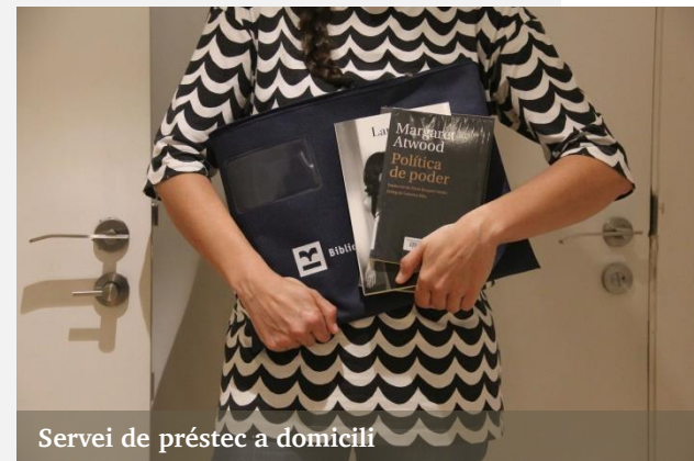
Servei de préstec a domicili

Espais sensorials a dues biblioteques. Les sales sensorials afavoreixen l'atenció i el benestar amb materials i dispositius electrònics que juguen amb el so, la llum o la vibració. És un entorn dissenyat especialment per a l'estimulació sensorial i que permet adequar els estímuls, controlar el soroll, la il·luminació o la temperatura. Es tracta d'un espai agradable, segur i accessible des d'un punt de vista físic i cognitiu, que afavoreix l'atenció i promou l'exploració, el plaer i els sentiments de benestar servint-se de diversos dispositius i materials. L'objectiu d'aquest espai sensorial és, d'una banda, fer accessible la biblioteca a persones amb desordres sensorials i, de l'altra, iniciar un projecte de foment de la lectura vivencial i innovador. Les sales sensorials són eines d'innovació en la dinamització de la lectura, així com milloren l'accessibilitat i fan de les biblioteques espais més inclusius.