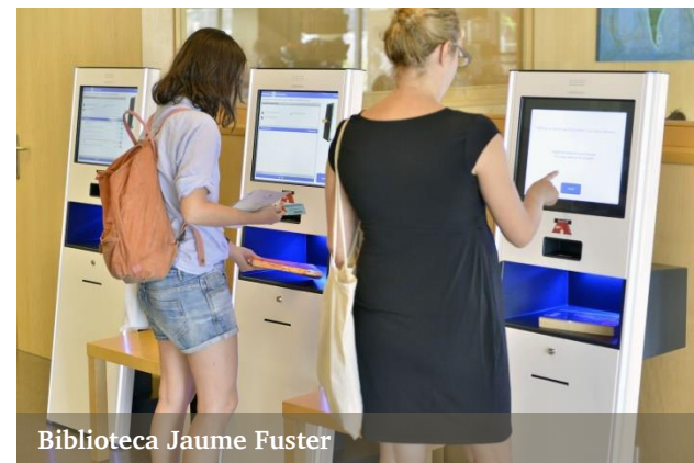
Biblioteca Jaume Fuster