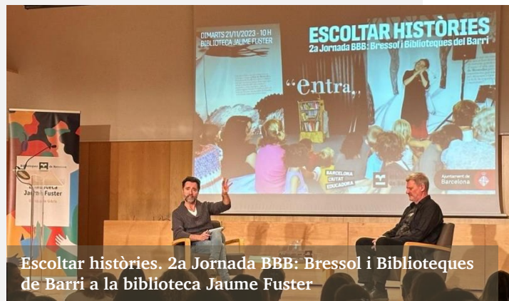
Escotar històries. 2a Jornada BBB: Bressol i Biblioteques de Barri a la biblioteca Jaume Fuster

Al conjunt de propostes hi van assistir més de 800 professionals.