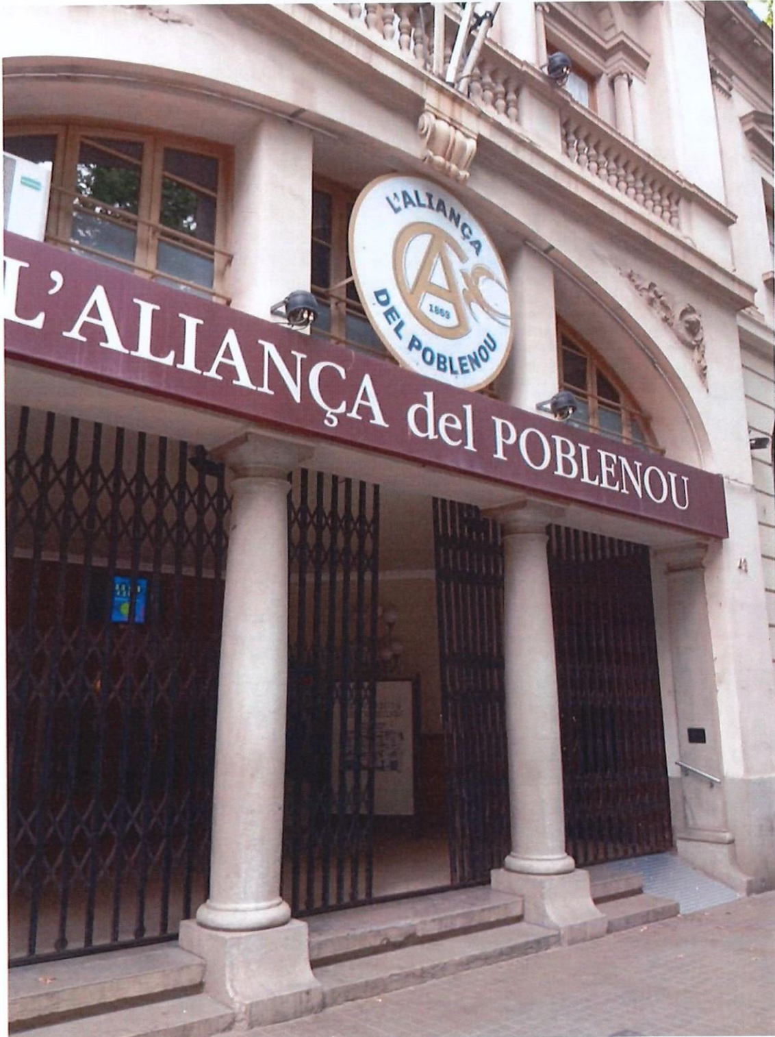
FOTO DE REIXA ANTIGA