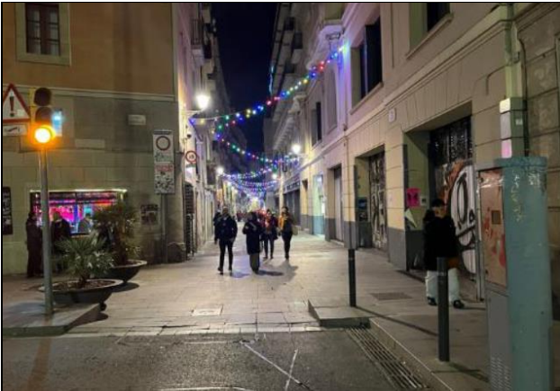
Entrar pel carrer dels Tallers a l'altura de plaça de Castella amb la piona hidràulica abaixada (1)