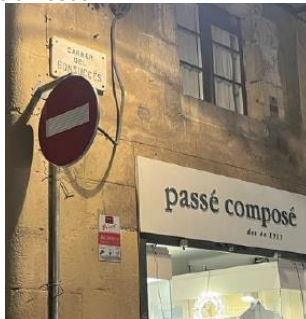
Cruïlla Sitges i Bonsuccés