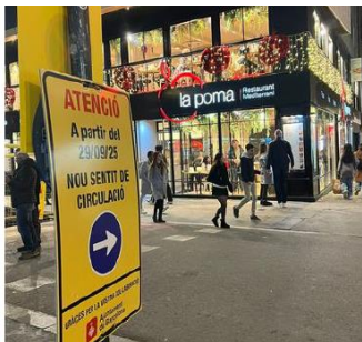
Cruïlla Rambla amb Bonsuccés

Nous sentits de la circulació, ara en direcció Besós