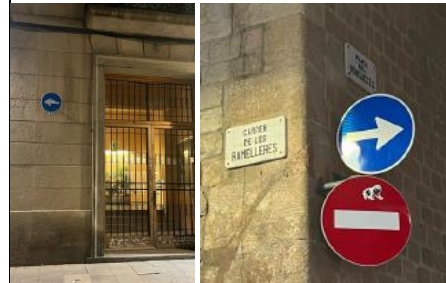
Senyal davant de la pl. Bonsuccés, que obliga a circular en sentit Llobregat.