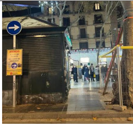
Girar la Rambla direcció mar (2)

Nous sentits de la circulació, ara en direcció Besós