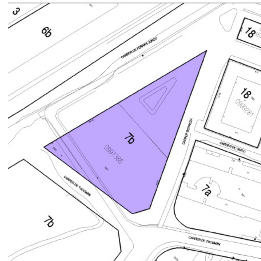
PLANEJAMENT VIGENT E:1/2.000