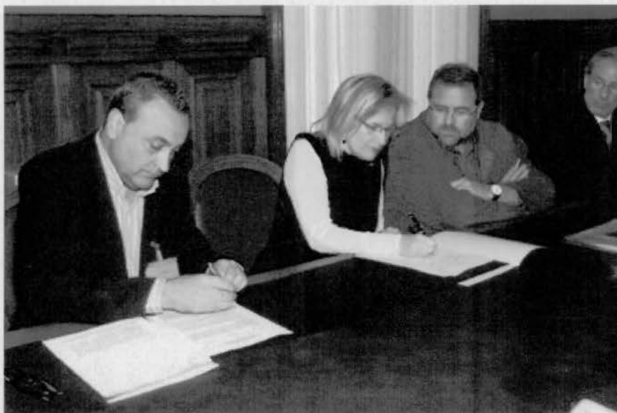
Fotografia de l'acte de signatura, el 30 d'abril de 2009

En aquest context, Tersa i Engrunes signen un Acord Marc de col·laboració per accedir conjuntament a la gestió de deixalleries de l'Àrea Metropolitana de Barcelona.