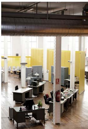
Espai oficines per projectes