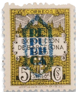
Exposició Universal 1888