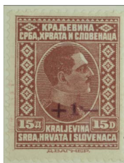
1+15 Dinars Alexandre I de Iugoslàvia. Iugoslàvia 1926-1927