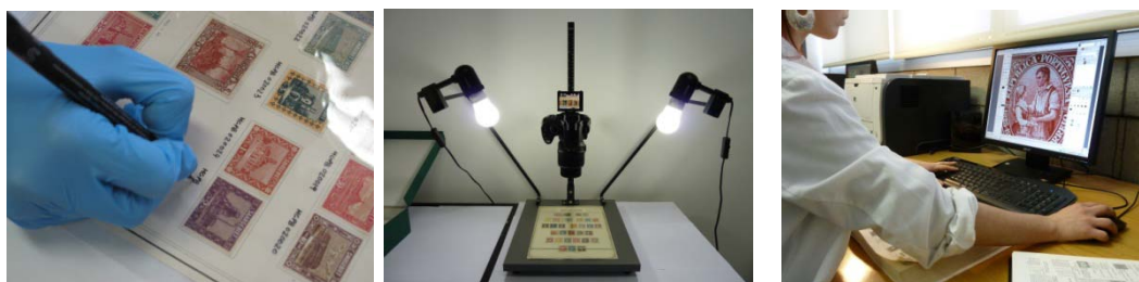
Registre, digitalització i posada en línia de la Col·lecció Marull.

El projecte ofereix en definitiva la possibilitat de conèixer una col·lecció filatèlica d'abast universal, organitzada amb criteris documentals molt metòdics i contrastats bibliogràficament. Durant l'any 2013 es previst, a més a més, fer les traduccions a l'espanyol i l'anglès del conjunt dels continguts del lloc web per tal de promoure una més gran difusió i projecció de la col·lecció.