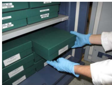
Maquetem Col·lecció Marull. Centre de Restauració de Béns Mobles (ICUB).

D'aquesta manera, assegurada la conservació, s'inicia un projecte de revisió de continguts de la col·lecció filatèlica amb l'objectiu principal de donar-la a conèixer en profunditat . Es tracta de