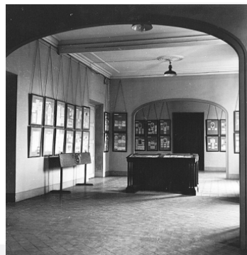
Exposició permanent al Palau de la Virreina, desembre de 1959

La designació del Palau de la Virreina, l'any 1984, com a seu de la Regidoria de Cultura de l'Ajuntament de Barcelona va portar a reorganitzar els espais amb noves funcions no pròpiament museístiques i a situar el Gabinet Postal en un altre indret, destinació no assolida fins al 1990. Malgrat que estava previst que el Museu Gabinet Postal de Barcelona s'ubiqués al primer pis del Palau de Pedralbes , ocupant una extensió de poc més de 167 m 2 , aquesta previsió no es va dur