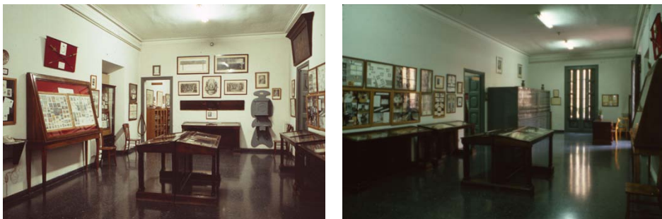
Exposició permanent al Palau de la Virreina, abril de 1987.

a terme i el museu va romandre tancat i la seva col·lecció desada als magatzems del palau. El tancament va significar la desaparició de l'escena pública del Museu Gabinet Postal de Barcelona des de l'any 1990, i amb ell el de la col·lecció Marull. En conseqüència, també comportà l'aturada en l'increment de les col·leccions i en l'estudi especialitzat del seu contingut.