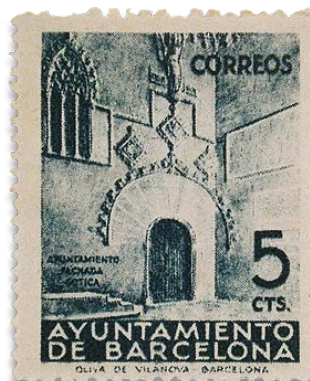
Façana gòtica Ajuntament