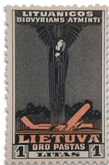
1 Litas. Avió estavellat. Al·legoria de la Morta. Lituània 1934.

La posada en marxa del web un cop registrada i documentada una significativa part de la col·lecció, i a l'espera de la documentació i digitalització completa, representa el punt d'arrencada d'un nou projecte cultural altament singular per la ciutat. Un projecte amb un gran contingut innovador i que es formula com una eina per a difondre l'aprenentatge i la divulgació de coneixement. El desenvolupament associat de recursos i eines a la digitalització de la Col·lecció Marull ha de permetre satisfer l'expectativa del públic expert i no-expert, generar interactivitat que permeti atraure a nous públics i constituir-se, en definitiva, com una font de coneixement i de consulta de la història.