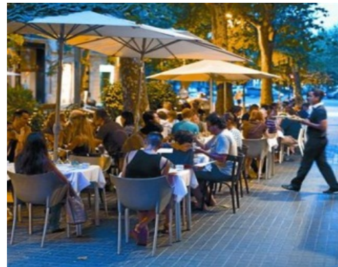
Pla de Comerç Ordenança de Terrasses

AGENTS ECONÒMICS I CENTRES DE CONEIXEMENT