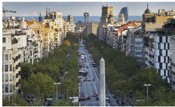
Passeig de Gràcia