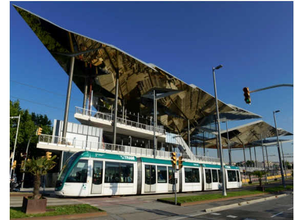
Mercats: Bellcaire, Ninot, Sant Antoni