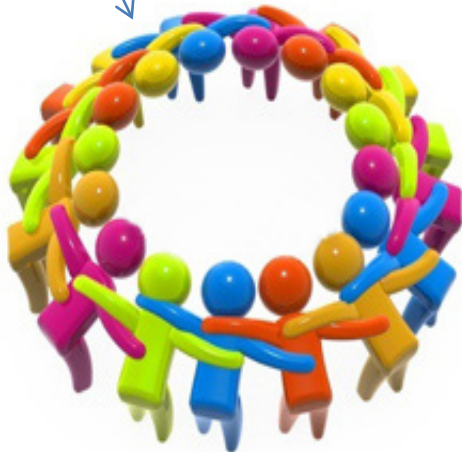
Foment del treball en xarxa de les entitats

ENTITATS, ASSOCIACIONS I AGENTS ESPORTIUS, SOCIALS I CULTURALS