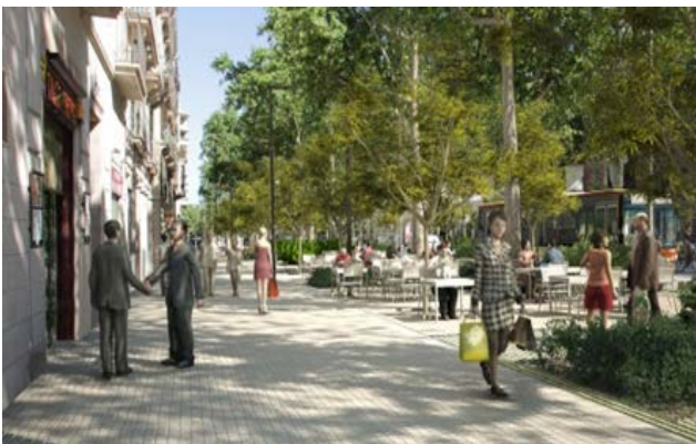
Passeig de Sant Joan