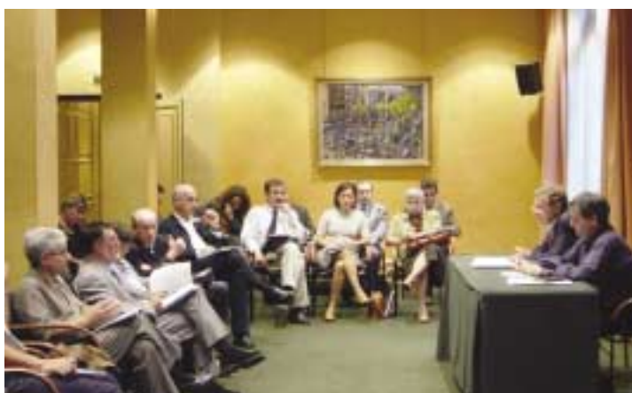
Reunió de la Subcomissió de Transports, habitatge i model metropolitana

La comissió ha centrat el seu debat en tres eixos de transformacions importants: canvis demogràfics, canvis en les estructures familiars i augment en els fluxos migratoris . I a partir d'aquestes tendències les propostes formulades giren a l'entorn de qüestions com: redefinició d'un nou sistema de serveis de benestar, conciliació treball-família, sistema de gestió metropolitana, una nova ciutadania, un nou contracte social pel benestar, coordinació entre administracions, pacte metropolitana per la governabilitat i un treball en xarxa metropolitana.