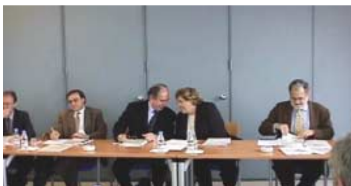
La Comissió delegada al Centre Internacional de Negocis de Badalona

A tall de resum poden identificar-se els temes principals que han centrat les sessions en cada una de les reunions.