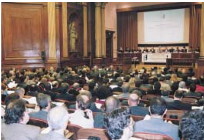
1r Consell General

El segon Consell General es va celebrar a la Farga de l'Hospitalet de Llobregat, el 8 de juliol de 2002. En aquest cas, es van presentar els eixos de treball de les Subcomissions de Prospectiva a càrrec de la presidenta de la Comissió de Prospectiva i dels presidents de cada Subcomissió.