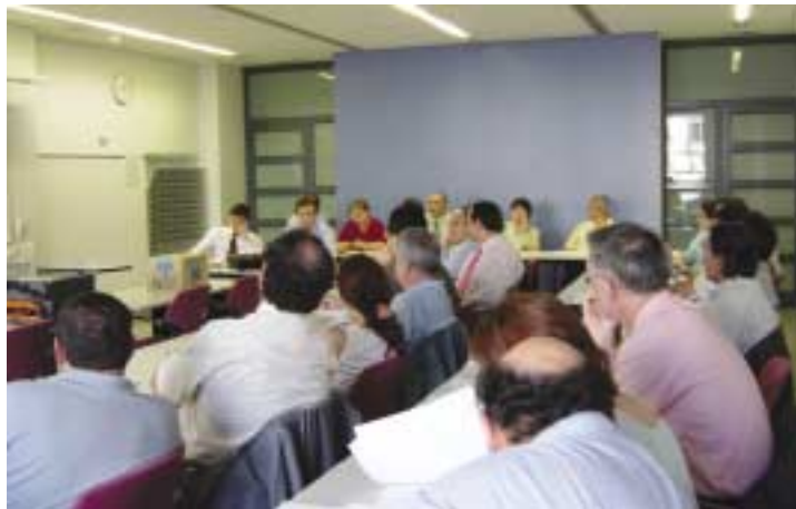
Reunió de la Subcomissió de Lideratge i globalització

La subcomissió ha centrat el seu debat a l'entorn de tres temes: habitatge, transport i logística i el model territorial . De les propostes estratègiques plantejades, es poden destacar els aspectes següents: No segregació de l'espai en àrees d'activitat i àrees d'habitatge, Densificació urbana, política d'habitatge de protecció oficial, integració espacial de les famílies immigrants, la logística a l'interior de les ciutats, la logística de llarga distància i les infraestructures que es requereixen, el transport públic i la seva intermodalitat, la xarxa viària, potenciació de les polaritats urbanes, els espais lliures territorials, els components mediambientals i la definició d'un model territorial metropolità.