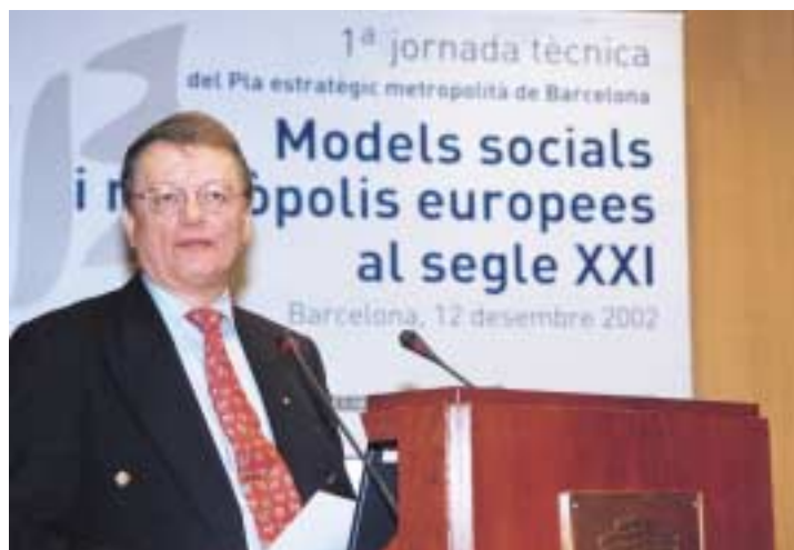
Carl Cedershiöld, ex-alcalde d'Estocolm