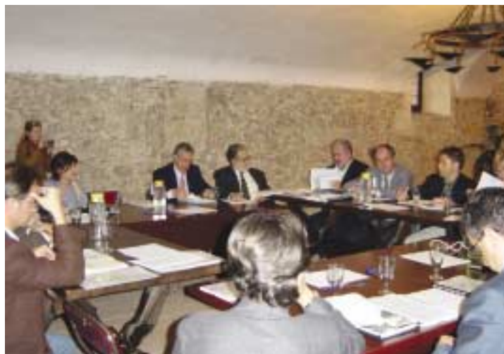
Comissió delegada al castell del Papiol

En el cas de la reunió realitzada en el municipi del Papiol, l'objectiu va ser analitzar l'informe intermedi de les subcomissions de prospectiva, que ja havien treballat durant tres mesos. A l'informe s'avançaven unes primeres conclusions del debat i es destacaven els temes més recurrents en cada grup. També es va presentar la proposta d'esborrany referida a la gestió de l'aeroport de Barcelona i el mapa dels 43 grans projectes metropolitans.