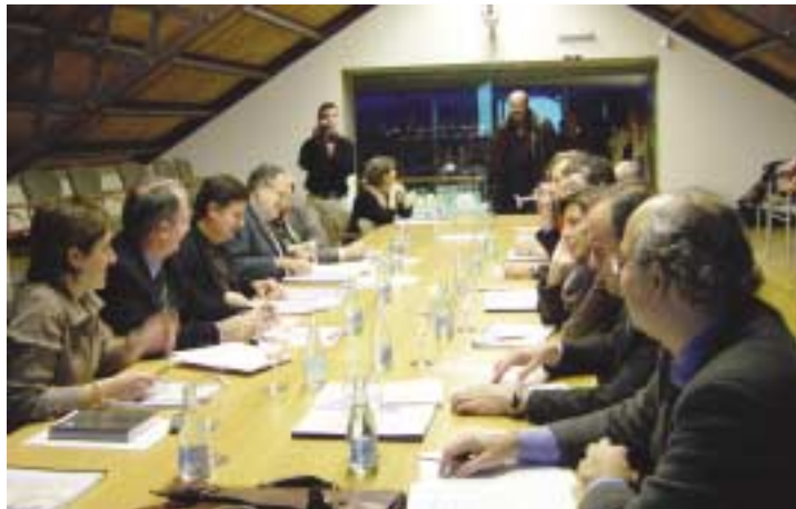
Comissió delegada al Prat de Llobregat

En la darrera sessió de l'any, realitzada en el municipi del Prat, el tema central va ser la construcció de la missió i la visió del 1er Pla estratègic metropolità de Barcelona. En la sessió s'analitzaren els principis i els valors que ha de tenir el Pla i s'avançà en la definició inicial de l'objectiu del Pla. El debat va abordar amb amplitud la dimensió i l'abast sobre els grans temes estratègics que afecten a l'àrea metropolitana de Barcelona.