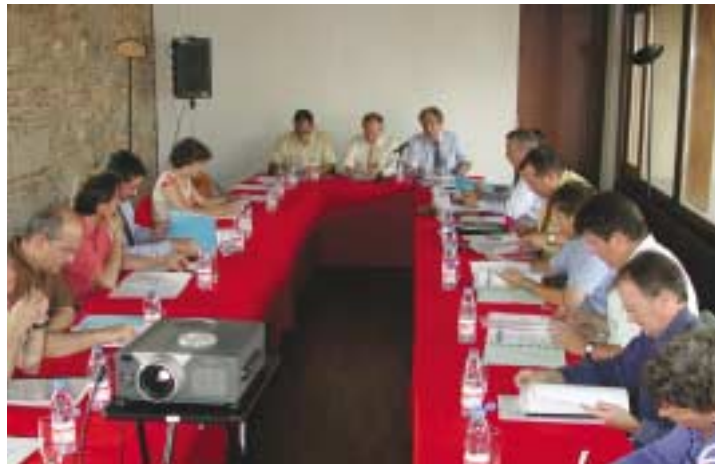
La Comissió delegada a Cornellà

A la reunió de Badalona l'objectiu principal va ser la posada en funcionament de les subcomissions de prospectiva a partir de les conclusions dels primers grups de treball, que varen servir per a centrar els temes claus del debat i la seva incidència en l'àmbit metropolità.