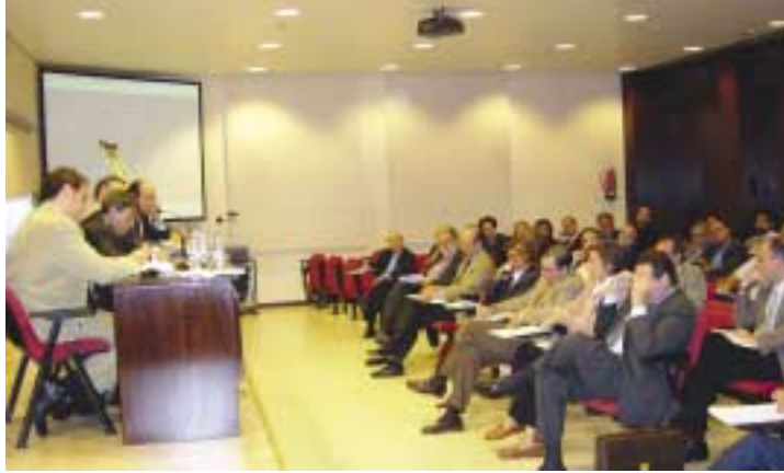
Reunió de la Subcomissió de Dinamització econòmica