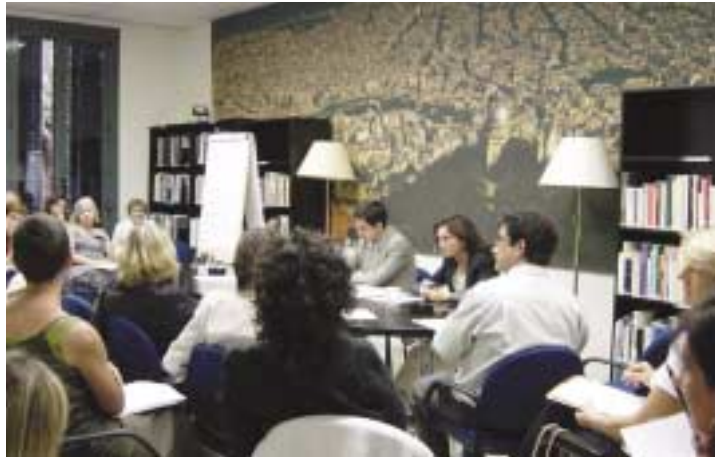
Reunió de la Subcomissió de Capital humà

El resultat final dels seus treballs ha estat objecte d'una edició en la col·lecció de documents de treball del Pla. En qualsevol cas i a tall de resum, molt esquemàtic, es destaquen els temes que han estat analitzats per cadascuna d'elles, segons la descripció següent: