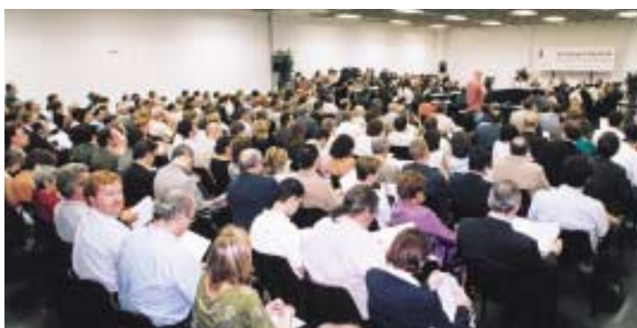
2n Consell General