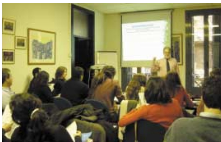
Sessió del Màster "La ciutat"

21 de novembre, participació del Coordinador general a la Jornada "Programas Integrales de desarrollo urbano y nuevos modelos de gobernanza urbana" organitzades per la Universidad Complutense de Madrid en el marc del proyecto europeo UGIS del V Programa marc.