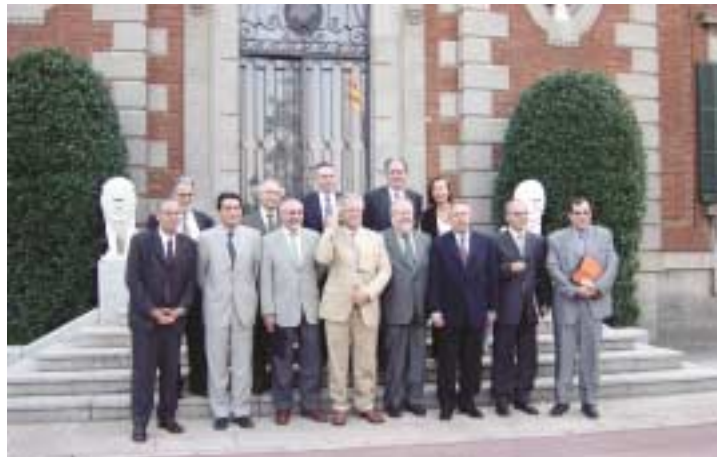
Signatura del conveni de col·laboració amb les ciutats mitjanes de la RMB

Per part del Pla Estratègic Metropolità de Barcelona: