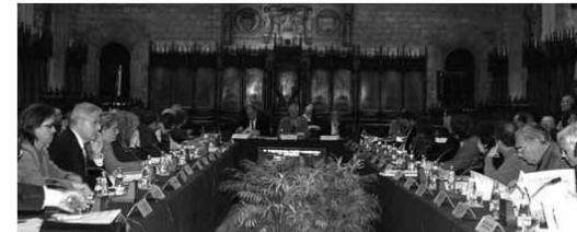
Plenari del Consell de Ciutat de 22 de novembre de 2005, Saló de Cent

Benvinguda de l'alcalde | Què és el Consell de Ciutat | Composició | Funcionament | Agenda | Debats | Documents | Contacteu