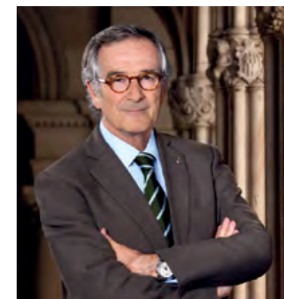
Xavier Trias Alcalde de Barcelona

Por todo esto, el sector agroalimentario es uno de los sectores estratégicos de futuro para el Ayuntamiento de Barcelona y, dentro de este sector, Mercabarna se erige como su puntal.