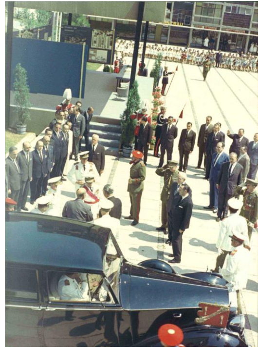
Imatges de l'època en que va ser inaugurada la plaça. A la foto de la dreta, el dictador Franco assisteix a l'acte d'inauguració oficial