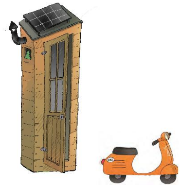
Il·lustració "casa de l'Ona" de Roser Capdevila

La primera actuació destacada d'aquets tipus es durà a terme abans que acabi el mandat a la plaça Sant Miquel, al districte de Ciutat Vella. Serà una àrea de jocs temàtica: la casa de la girafa Ona. Tots els elements de joc estan fets i dissenyats seguint l'estil i la personalitat dels personatges dels contes de l'Ona, i la seva construcció estarà supervisada per la seva creadora, Roser Capdevila . Aquestes instal·lacions es pensen per satisfer edats diferents, i la tria dels jocs es fa segons un l'argument de conte per fer-los atractius a nens i nenes de 0-3 anys i complaure als més grans de 3 anys.