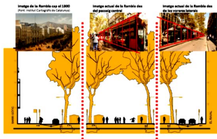
Pèrdua de relació entre façanes com a conseqüència de l'efecte de barrera per la disposició i característiques dels quioscs actuals.

Aquest bloc es refereix a la definició de l'espai de la Rambla, la regulació dels sistemes dels espais d'estada en el passeig així com els elements urbans existents (escocells, cadires, fonts, mosaics). L'objectiu és concretar les possibles formes d'ordenació de l'espai del passeig, millorar la relació visual de façana a façana, actualment trencada i interrompuda pels elements situats al mig del passeig, i millorar l'accessibilitat i la connectivitat.