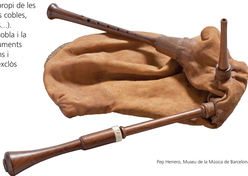
Pep Herrero, Museu de la Música de Barcelona

Aquest instrument és propi de les cobles antigues (mitges cobles, cobles de tres quartans...). Amb la reforma de la cobla i la incorporació dels instruments greus de metall (fiscorns i trombó), el sac va ser exclòs de la cobla moderna.