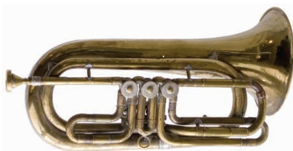
Pep Iglesias, Museu d'Història de Girona

El fiscorn és un instrument de la mateixa família que la trompeta. Enlloc d'utilitzar un sistema de pistons fa servir un sistema de cilindres o vàlvules per tal de poder fer totes les notes de l'escala musical. És més gran que la trompeta i té un registre de so més greu (una octava).