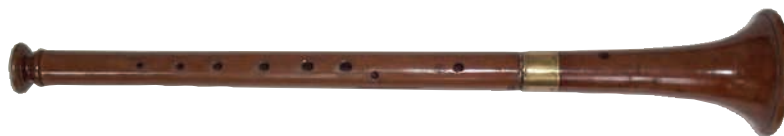
Pep Iglesias, Museu d'Història de Girona

La tarota pertany al grup de les xeremies. Aquests instruments es caracteritzen per ser un tub cònic amb uns forats, un tudell i una doble canya. La gralla, el grall del sac de gemecs, la dolçaina i el tiple són instruments molt similars.