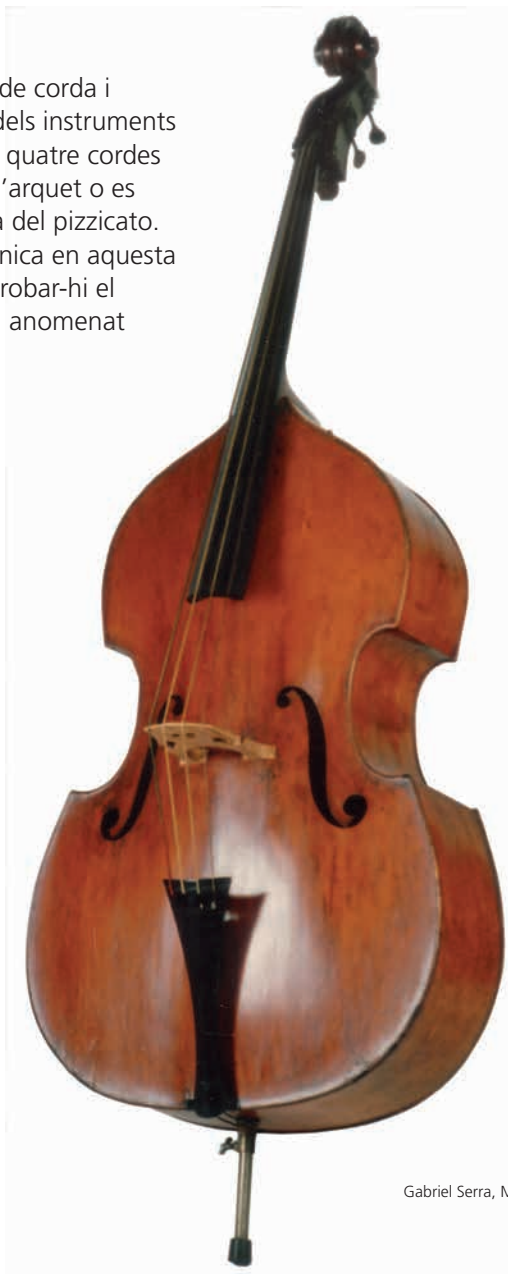
Gabriel Serra, Museu de la Música de Barcelona

El contrabaix és l'únic instrument de corda i també el més gran. De la família dels instruments de corda fregada, el contrabaix té quatre cordes metàl·liques que es fregen amb l'arquet o es polsen amb els dits amb la tècnica del pizzicato. Té una clara funció rítmico-harmònica en aquesta formació musical, on és habitual trobar-hi el contrabaix de tres cordes de tripa, anomenat popularment berra.