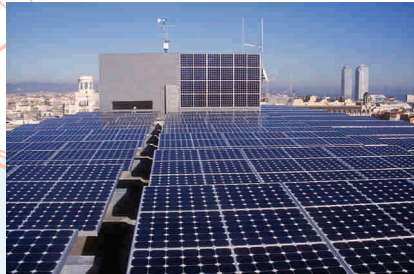
Panells solars fotovoltaics de l'Ajuntament

Barcelona aposta per una nova cultura de l'aigua, per garantir l'eficiència energètica i per potenciar l'ús d'energies renovables.