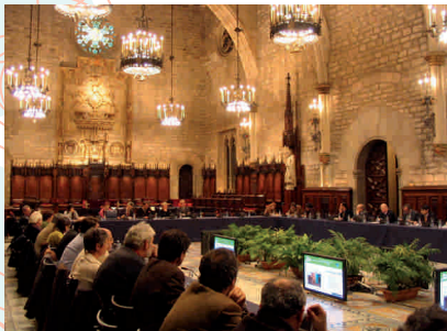
Plenari del Consell Municipal de Medi Ambient i Sostenibilitat

Barcelona treballa en diferents àmbits socials per garantir el benestar de la ciutadania: educació i accés al coneixement i a les noves tecnologies, ocupació i habitatge, salut pública, integració de persones amb discapacitat, immigració i multiculturalitat.