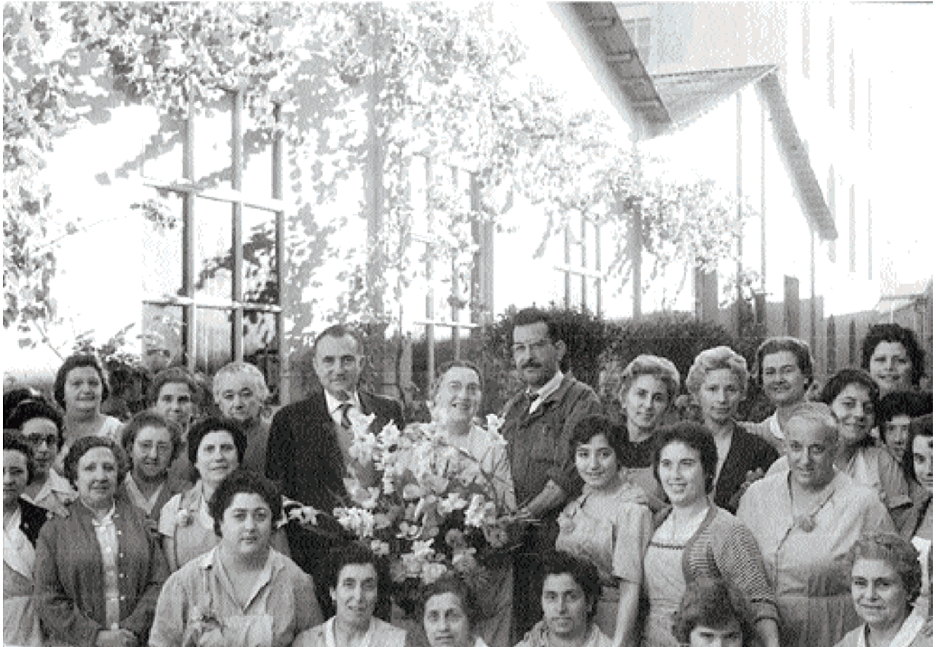
Treballadores i treballadors de Can Fabra, 1960.

esmentat i el seu gendre Camilo Fabra i Fontanils. La societat fabricava fils de cotó en troques i, posteriorment, rodets i troques. Anys a venir van diversificar la seva producció amb xarxes de pesca i cintes de fil i cotó, fabricades a la factoria de Salt, Girona. El 1903 es crea la Compañia Anónima Hilaturas de Fabra y Coats, que procedeix de les anteriors i la fusió amb Barcelona Manufacturing Co., Ltd.(el marquès d'Alella era propietari de Can Fabra) que arribà a concentrar 1.500 operaris, entre la factoria de Sant Andreu i