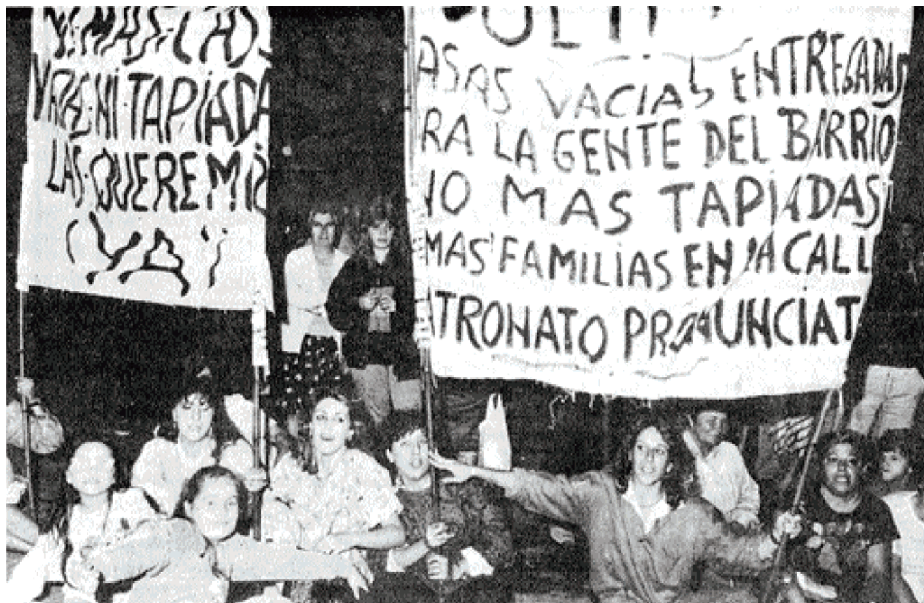
octubre del 1988

Manifestació a la plaça Orfila per que s'entreguin les cases buides a la gent del barri de Bon Pastor, 1988.