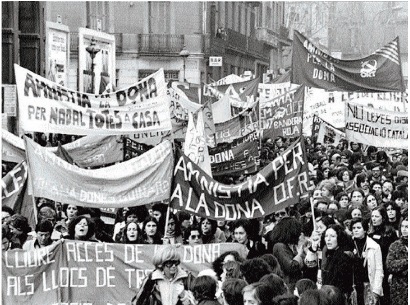
Manifestació de dones pels carrers del centre de la ciutat en demanda de l'Amnistia per la dona i lliure accés als llocs de treball, 1978.