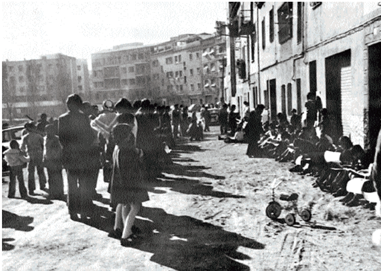
Jornada de reivindicació de l'Escola Pública, avui Ramon Berenguer, a la Trinitat.

la vora eren: l'Institut de la Guineueta -a dalt de tot, tocant la Vall d'Hebron-, els barracons imprementables del Passeig de Valldaura, el tres instituts de la Verneda, el Barcelona-Congrés, l'Alzina i el de Valldemosa. Tots ells a unes distàncies considerables. Les dones també van demanar informació, preus i dates de matriculació dels centres privats del barri i els seus voltants. Amb aquest llistat i informacions, van convocar una reunió amb les famílies de les