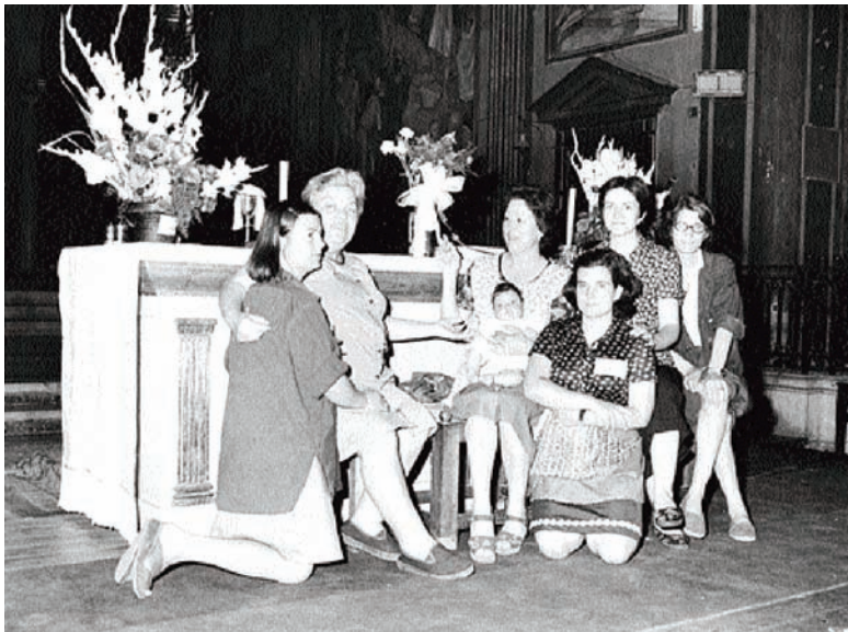
Tancada de dones de Motor Ibérica a la parròquia de Sant Andreu, juny del 1976.