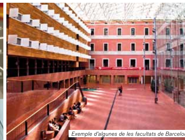
Exemple d'algunes de les facultats de Barcelona

en l'actualitat amb més de 233.000 estudiants universitaris, dels quals uns 20.000 són d'origen forà, i la gran majoria estan ubicats en institucions de l'àmbit metropolità de Barcelona.