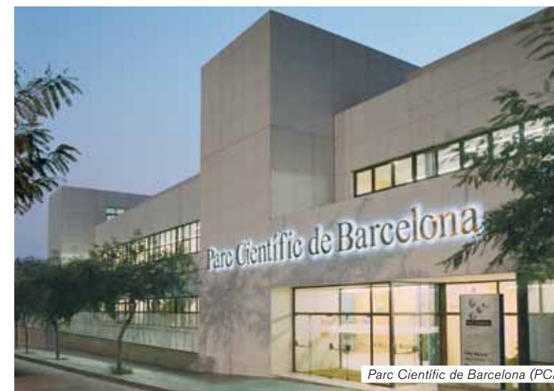
Parc Científic de Barcelona (PCB)

És un centre creat l'any 2009 que té com a missió dur a terme projectes d'anàlisi de seqüències d'ADN a gran escala en col·laboració amb investigadors de Catalunya, Espanya i Europa. El CNAG ofereix una àmplia gamma d'aplicacions, incloent la seqüenciació completa de genomes de novo , la reseqüenciació completa de genomes, la reseqüenciació de regions concretes, la seqüenciació d'ARNm o micro ARN (RNAseq), la localització de llocs d'unió a l'ADN o ARN (ChIPseq), la seqüenciació d'epigenomes i la validació de variants genòmiques. Està previst que es converteixi en un dels 5 centres de seqüenciació més importants d'Europa.