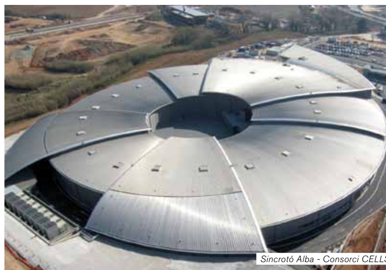
Sincrotró Alba - Consorci CELLS

Barcelona concentra diverses infraestructures de prestigi internacional amb un enorme potencial per fer-hi recerca avançada. Aquestes infraestructures constitueixen un pol d'atracció de talent, tant de científics d'arreu del món, com per generar i desenvolupar nous projectes.