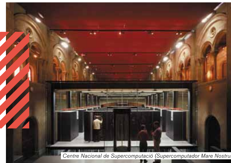
Centre Nacional de Supercomputació (Supercomputador Mare Nostrum)

10 raons que converteixen Barcelona i Catalunya en un referent en Educació Superior