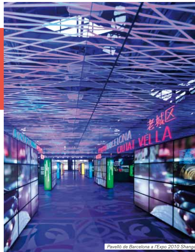
Pavelló de Barcelona a l'Expo 2010 Shangai

Els objectius dels CEIs, són entre altres, la millora de la qualitat de les universitats, la potenciació de la seva