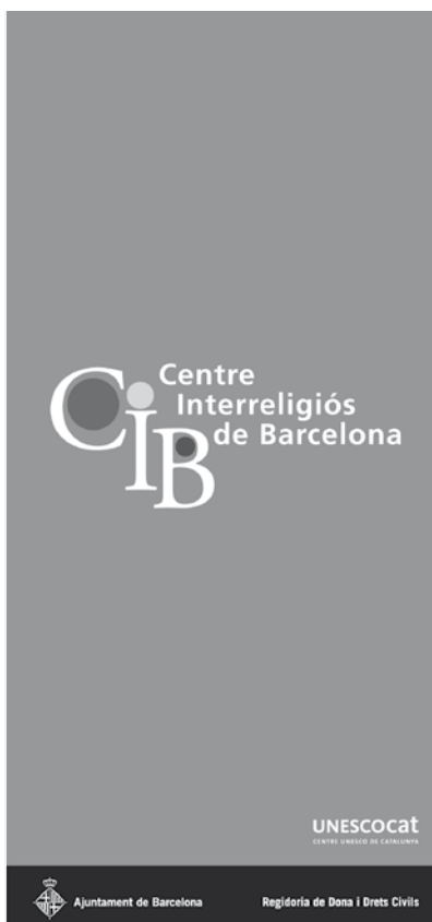
Tríptic del Centre Interreligiós de Barcelona

Actualment, el CIB és gestionat per Unescocat-Centre Unesco de Catalunya i realitza les següents funcions: