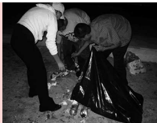
Membres de l'Associació de Reis i Reines Llatins fent tasques de neteja en un espai públic

– La tasca d'acompanyament dels joves va evidenciar la necessitat d'escoltar les seves idees i necessitats, i en aquesta línia es va considerar imprescindible el seu apropament als espais juvenils i serveis de la ciutat com una via integradora en l'entorn. Els joves, davant la necessitat d'expressar-se i de dir qui són a la societat, van prendre el llenguatge musical com una via per canalitzar els seus neguits i necessitats.