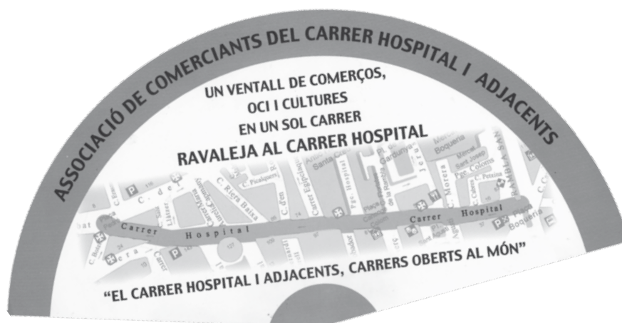
Ventall promocional d'una associació de comerciants que assumeix la diversitat cultural com a pròpia

Aquests nous comerciants autòctons i estrangers de perfil innovador i mentalitat cosmopolita, també poden imprimir molt dinamisme a la renovació de les associacions