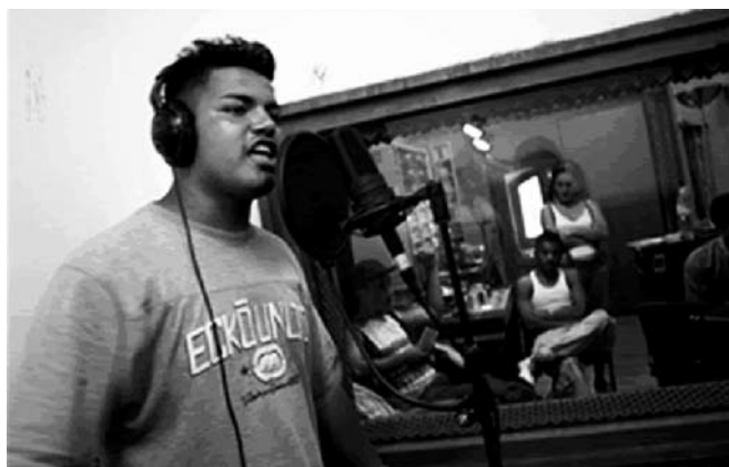
Enregistrament del disc "Latin Kings. The Royal Life"

Malgrat l'alarma social per les «bandes llatines» que ha afectat la imatge dels joves llatinoamericans, la situació a Catalunya es troba lluny d'aquesta realitat. De fet, a l'Estat espanyol existeixen dues grans organitzacions juvenils llatinoamericanes, els Latin Kings i els Ñetas. D'entrada, cal remarcar que mai s'han sentit com a «bandes juvenils» perquè el terme «banda» porta connotacions negatives i en certa manera al·ludeix a grups relacionats amb actes delictius. No hi ha dades concloents que ens portin a pensar que aquests joves representen un problema de seguretat, més aviat ha estat el ressò mediàtic entorn dels delictes protagonitzats per alguns dels seus membres, el que ha maximitzat la situació real.