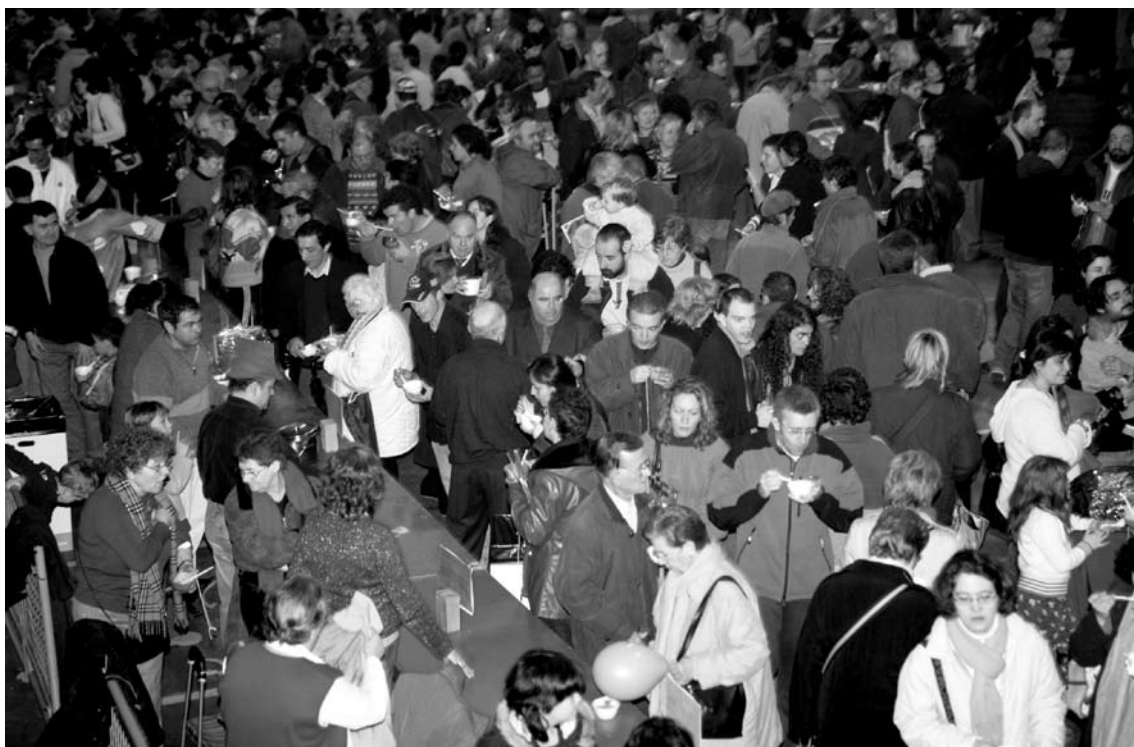
Festival de sopes, organitzat per la xarxa 9 Barris Acull

Podem, però, tot atenent al que s'ha dit anteriorment, establir tendències generals o línies de comportament d'una manera generalista? Sí, però amb cautela, perquè en realitat, quan decidim ser part activa de la realitat que ens toca encarar quotidianament, ja s'ha vist que hi juguen molts factors i elements, i no solament una voluntat individual i personal de formar-hi part. En tot cas, cal pensar que les pràctiques i cultures polítiques d'origen, del país d'origen, hi juguen molt, atès que no és el mateix viure en un país amb governs dictatorials i sistemes autoritaris de participació, que partir d'una pràctica activa en un país democràtic o amb un tarannà permissiu. També hi fa un paper molt important el factor urbà i/o rural, ja que normalment l'experiència prèvia en un determinat tipus d'associació o pràctica participativa és força decisiva. A més, formar part d'una societat urbana, sigui on sigui, sempre permet dominar un conjunt de mecanismes i categories que no pas quan formes part del món rural, i moltes vegades d'un món rural que viu certs aspectes de la vida material i tradicional quotidiana amb 40 o 60 anys de diferència respecte de la realitat que es pot trobar en la nostra societat 25 , o en les societats dels països europeus occidentals.