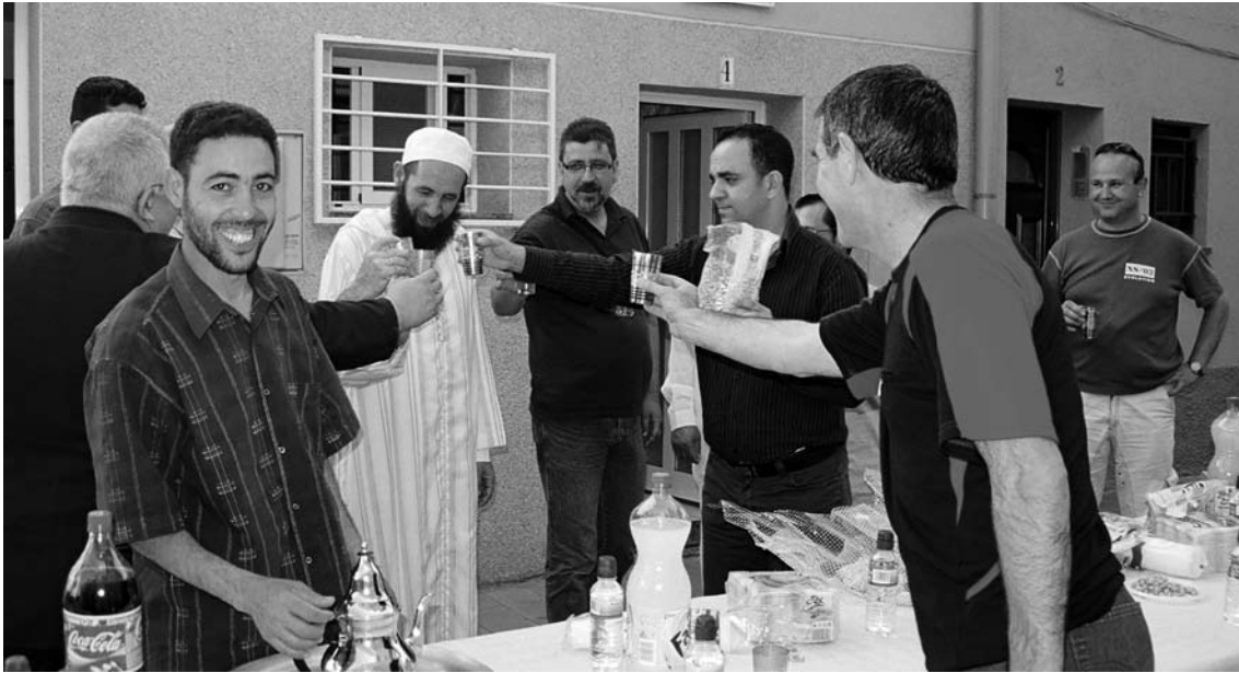
Jornada de portes obertes a la mesquita de Canovelles (2007)

aquest autor proposa un multiculturalisme democràtic , el contingut del qual «no debería ser la neutralidad cultural, sino la inclusión en la vida pública de los grupos marginales y en desventaja, incluso de las comunidades religiosas» (2000: 193). 8