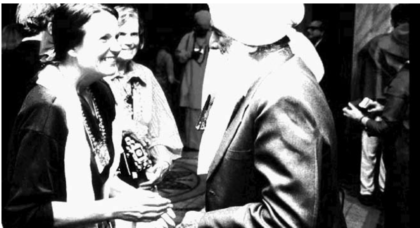
A Badalona, es promou el diàleg interreligiós. Il·lustració extreta del tríptic sobre el Programa per al diàleg ciutadà entre creences i conviccions

de «prevenció i de mediació en possibles conflictes amb connotacions interreligioses i interculturals». L'interès d'aquest programa és que sorgeix, en part, com a resposta a un conflicte entre la comunitat musulmana i una part del veïnat per la qüestió dels llocs de culte. En aquest sentit, a més d'oferir serveis semblants als del CIB barceloní (creació de grups de diàleg interreligiós, actes per donar a conèixer les diferents confessions i les seves activitats socials, promoure jornades de portes obertes, una trobada interreligiosa i intercultural anual...), l'Ajuntament badaloní ha aprovat també unes ordenances que regulen l'obertura d'espais de culte a la ciutat, i ha fet intents no reeixits per resoldre la necessitat de la comunitat musulmana de trobar un immoble per obrir-hi un centre de pregària amb condicions adequades. 28