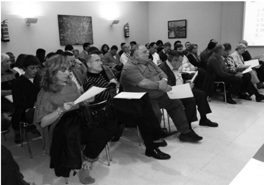
Imatge de la sessió de constitució del Consell de Ciutadania de Canovelles.

El Consell de Ciutadania, organitzat per comissions de treball, esdevé un espai de trobada per a les associacions. Molt sovint, les entitats presents en un territori són coneixedores les unes de les altres, però no sempre disposen d'espais on poder debatre i treballar conjuntament envers un objectiu comú. El fet de trobar-se periòdicament fomenta les relacions personals, que són el primer pas per a noves sinergies, que a la vegada permeten sortir de la realitat de la pròpia associació per treballar en xarxa amb altres entitats del territori.