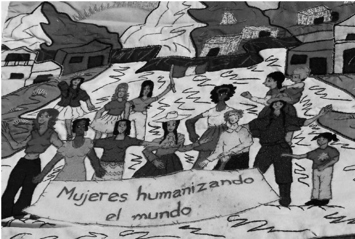
Tapís exposat al Fòrum Social Mundial celebrat a Nairobi (2007)

Una tercera característica és la que el filòsof Zygmunt Bauman qualifica de modernitat líquida . Les societats europees viuen en un estat de transformació i modernització vertiginosa, que moltes vegades ningú no sap què és ni cap on va. La modernitat és plena de riscos i d'incerteses, i això comporta un gran i greu sentiment d'inseguretat, de confusió i d'ambivalència. Segurament l'envelliment de les societats europees i la pèrdua de pes de la demografia europea a nivell mundial, contribueixen a fer palès, encara més, aquest futur incert i líquid.