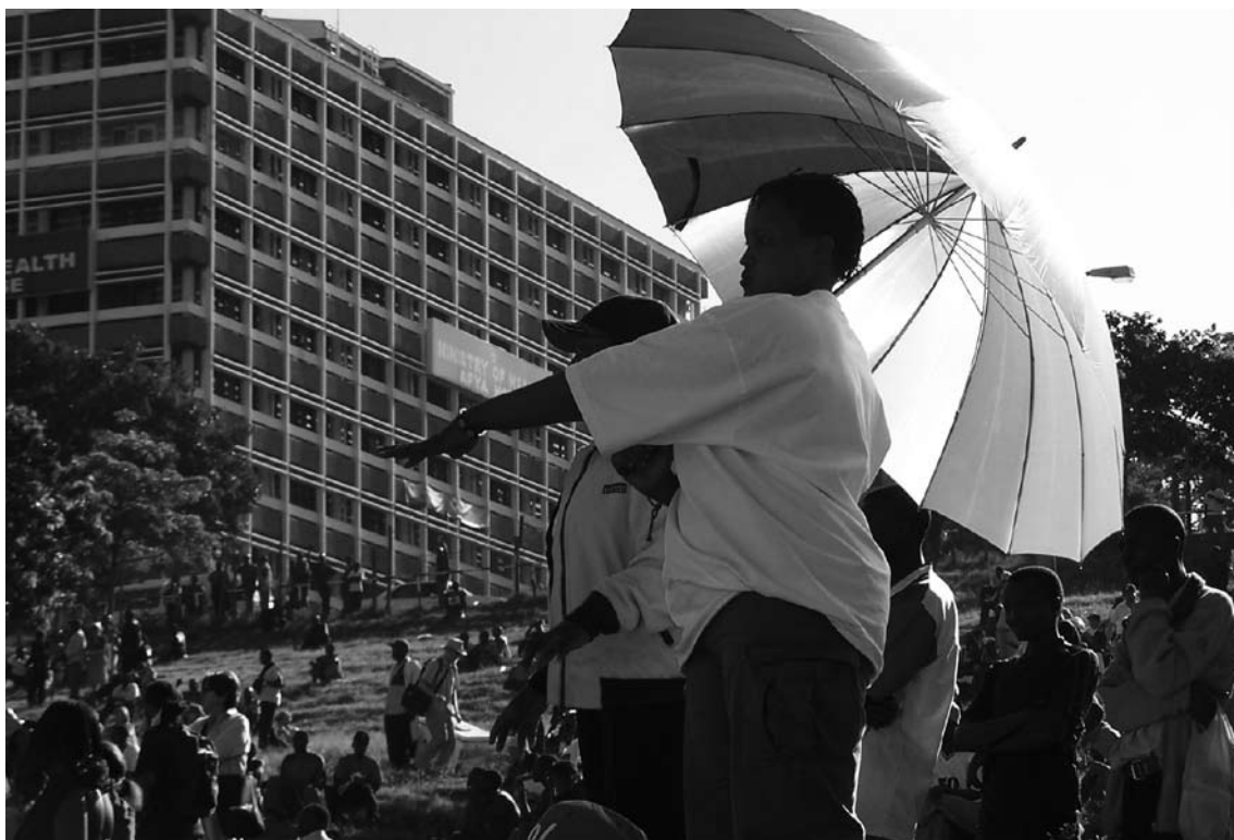
Imatge del Fòrum Social Mundial celebrat a Nairobi el gener del 2007

En aquest article ens fixarem que, si observem l'actual morfologia del teixit associatiu, el concepte de tercer sector s'ha de revisar. L'entorn, el que veiem cada dia –i no oblidem que és una rèplica del que passa al món–, obliga a replantejar-se les formes organitzatives, de relació amb l'entorn i la tria de les temàtiques a tractar (preses com a oportunitats del moment). I tota aquesta nova situació no hi ha dubte que es planteja com un repte i que modifica tant el pensament com l'acció, però també el comportament de la xarxa social.