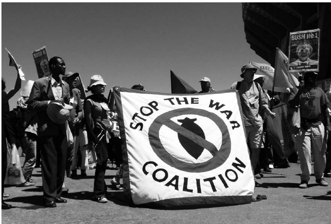
Manifestació contra la guerra de l'Iraq en el marc del Fòrum Social Mundial celebrat a Nairobi

El Fòrum de 2005, que torna a fer-se a Porto Alegre, marca un primer punt d'inflexió. S'havia prèviament consultat els moviments per tal de definir conjuntament els eixos temàtics de la trobada: en van sortir 11, que reagruparien totes les mobilitzacions. L'any 2006 es consolida l'expansió i s'experimenta un FSM descentralitzat, amb una pota a l'Amèrica Llatina (Veneçuela), una a l'Àfrica (Bamako) i una altra a Àsia (Karachi). Finalment el 2007, per primera vegada a la història, el FSM es fa a Nairobi.