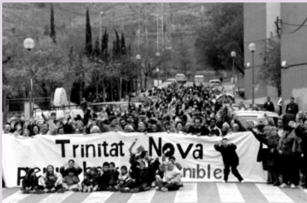
“Trinitat inNova, per un barri sostenible”