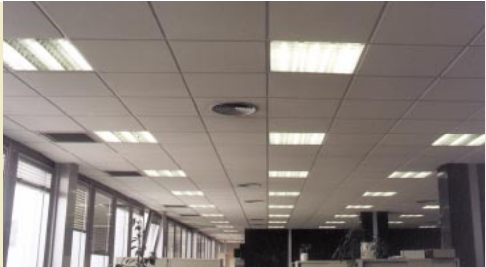
Una planta del edifici amb les noves lluminàries

USUARI Ajuntament de Barcelona Plaça de Sant Miquel s/n, 08002 Ciutat Vella