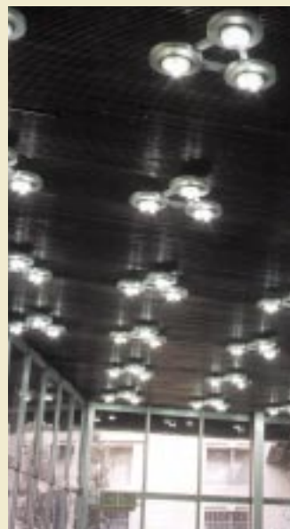
Vestíbul de l'edifici abans de l'actuació

(estudi previ, planificació, aplicació i execució), excepte l'avaluació dels resultats, que s'ha fet des de la regidoria de Ciutat Sostenible.