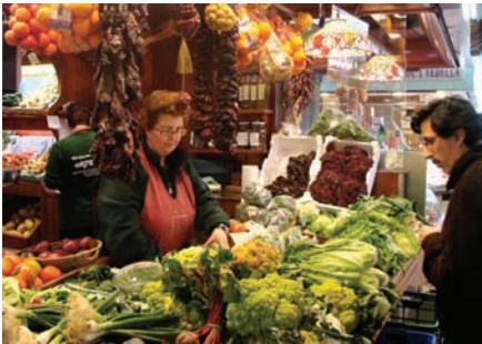
a. La verdulería