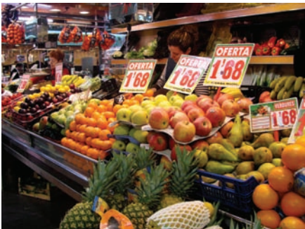
d. La frutería