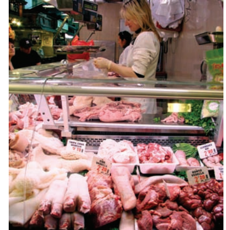
f. La carnicería