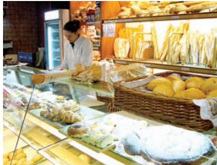
e. La panadería