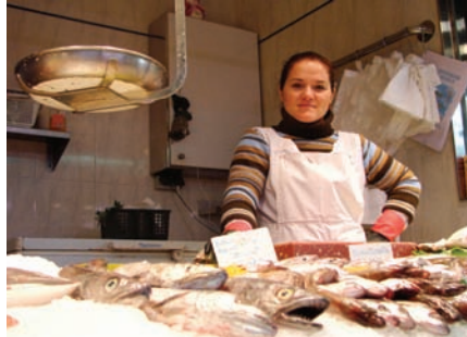
b. La pescadería