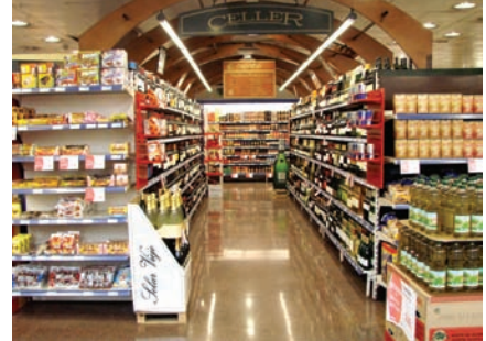
c. El supermercado