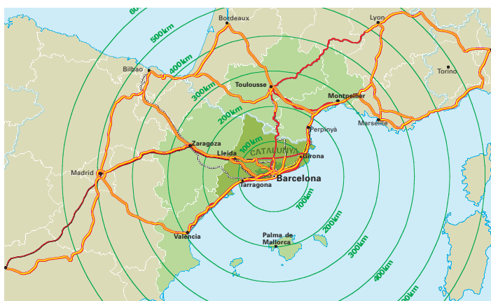
Mapa de localització de Barcelona amb radis concèntrics de la zona d'influència

Situada al Mediterrani nord-occidental, la regió metropolitana de Barcelona ha guanyat un bon posicionament internacional en termes de localització d'activitat econòmica, d'atracció de turisme, d'urbanisme i de qualitat de vida, avançant clarament cap a l'economia del coneixement. Encapçala una àrea emergent d'activitat econòmica al sud d'Europa de 17 milions d'habitants, que inclou les Balears, València, Aragó i el sud-est de França, i es consolida internacionalment com una de les principals metròpolis europees.