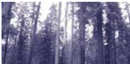
Boscos de Sierra Nevada

molt dura que fa que hi hagi molts endemismes propis d'aquesta formació.