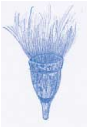
Flors bisexuals amb nombrosos estams