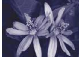
Grewia podoensis.

Aquesta prova pilot, feta amb els voluntaris dels dimecres cada 15 dies, durarà un any; passat aquest temps perfeccionarem la tècnica en el seguiment i en la transcripció en paper de les observacions fetes durant el treball de camp i començarem l'estudi fenològic d'aquelles plantes característiques de les zones mediterrànies ubicades a l'hemisferi sud del