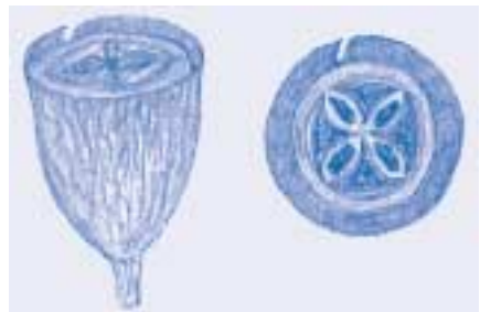
Càpsula llenyosa amb nombrosos forats per on s'escapen les llavors