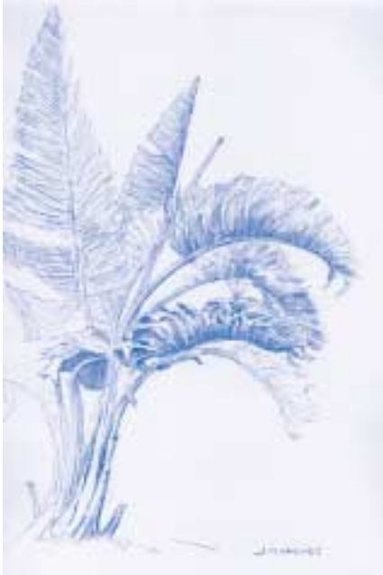
Strelitzia alba , il·lustració de Josep Sabanès, voluntari de l'Associació d'Amics.