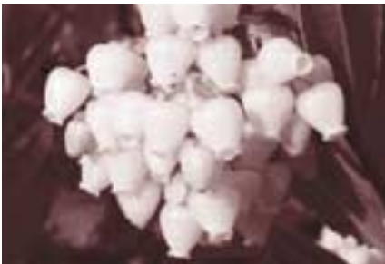
Flor d'arboç a la tardor

Volem relacionar els itineraris estacionals amb algunes tradicions, com la Castanyada a la tardor, i ho aprofitarem per parlar dels fruits. La tardor és l'època típica d'anar a collir bolets, sabem realment quina és la manera correcta i responsable d'anar-los a collir al bosc? A la tardor cauen les fulles, per què? Alguns arbres les perden, d'altres no; per què alguns arbres adopten estratègies caducifòlies i altres perennifòlies? Per què a la mediterrània hi ha més arbres perennes que al nord d'Europa?