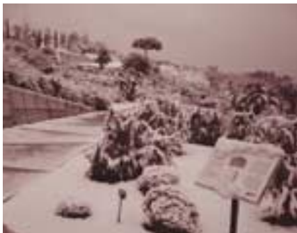
Imatge del Jardí després de la nevada del dia 28 de febrer

► Feia molt de temps que no succeïa, però al darrer trimestre s'ha hagut de demanar als voluntaris que no hi pugessin. El motiu: les baixes temperatures. A finals de gener i primer de març el fred va fer que els jardiniers recomanessin suspendre les jornades de treball.