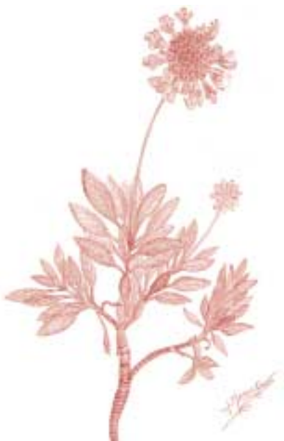
Scabiosa cretica , il·lustració de Jaume Morera i Font, voluntari de l'Assoc. d'Amics.