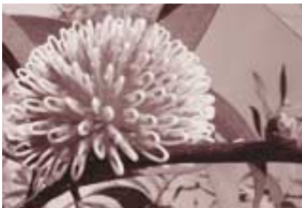
Hakea laurina a l'hivern

Aprofitant la vistositat de la floració, a cada estació, i a través de diverses plantes, estem dissenyant aquests itineraris que permetran que els visitants no es perdin aquest espectacle natural.