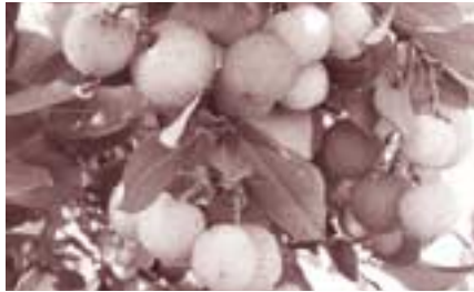
Fruits comestibles: cireres d'arboç

L'hivern és una època de repòs per als vegetals, la seva activitat metabòlica queda reduïda al mínim. Parlarem dels bulbs que passen l'hivern sota terra esperant que pugin les temperatures per desenvolupar la part aèria i florir. Aprofitarem que l'hivern és quan més ens refredem per parlar dels usos medicinals d'algunes plantes, de les que tenen propietats antisèptiques, antiinflamatòries, etc. Intentarem buscar una resposta a perquè arbres com els ametllers floreixen tan aviat malgrat el risc de gelades.