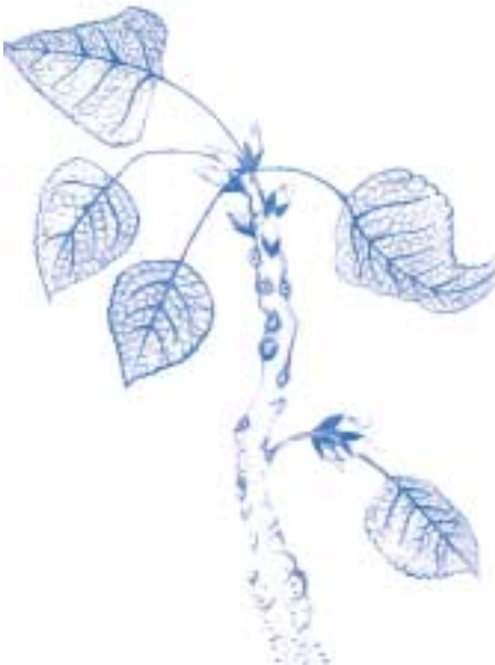
Populus pollancre , il·lustració d'Àngela Prat, voluntària de l'Assoc. d'Amics.

Voleu rebre la revista en format digital?