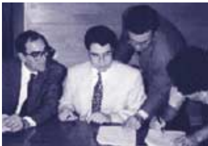
Imatge de la signatura formal de creació de l'Associació d'Amics

Per arrodonir-ho es va optar per construir-hi murs de terra armada, coberts amb un folre d'acer còrtex. Els murs de terra armada tenen l'es-