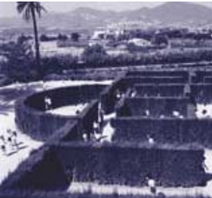
Parc de la Torreblanca, tocant a St. Feliu de Llobregat i dins dels termes de St. Just Desvern i St. Joan Despí

L'objectiu principal de la MMAMB és tractar el Jardí Botànic de Barcelona com a peça model i capdavantera d'aquesta Xarxa de Parcs Metropolitans. En aquest sentit, en el manteniment de la jardineria del Jardí s'experimenta amb l'aplicació de nous mètodes i materials, com per exemple l'estesa de triturat de poda i graves (per tal de millorar el substrat, reduir les pèrdues d'aigua per evaporació i controlar les males herbes), el reg per goteig i l'aprofitament d'aigües freàtiques. També és d'especial interès el coneixement de noves espècies de plantes mediterrànies que gràcies a la seva perfecta adaptació al nostre clima permeti emprar-les en projectes de jardineria sostenible.