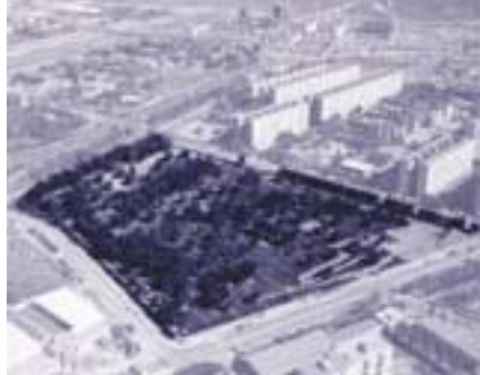
Panoràmica aèria del parc del Besòs, situat a l'oest de St. Adrià

Però, que és la MMAMB? La MMAMB és una associació de trenta-tres municipis de l'entorn de Barcelona creada l'any 1988 mitjançant un acord voluntari de cadascun dels ajuntaments. Les raons d'associar-se rau en el fet de compartir un àmbit territorial i funcional comú, densament poblat, amb espais, dotacions, serveis i infraestructures d'un intens ús social conjunt i, així mateix, en la necessitat de coordinar les actuacions institucionals i optimitzar els mitjans públics. Entre les diferents intervencions que du a terme, la