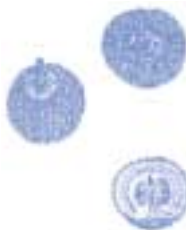
Fruit globós comestible