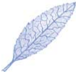
Fulles simples amb el marge dentat