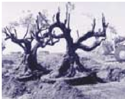
Maniobres per traslladar les dues "oliveres bessones"

ar l'any 1930 Pius Font i Quer. Per problemes pressupostaris, durant llargues temporades va restar tancat al públic. L'any 1990, en canvi, va tenir problemes d'estabilitat de vessants a causa de la construcció d'unes escales mecàniques amb motiu dels Jocs Olímpics (es tornaria a reobrir a final de l'any 2003). Això va propiciar la creació d'un nou jardí botànic a Barcelona.