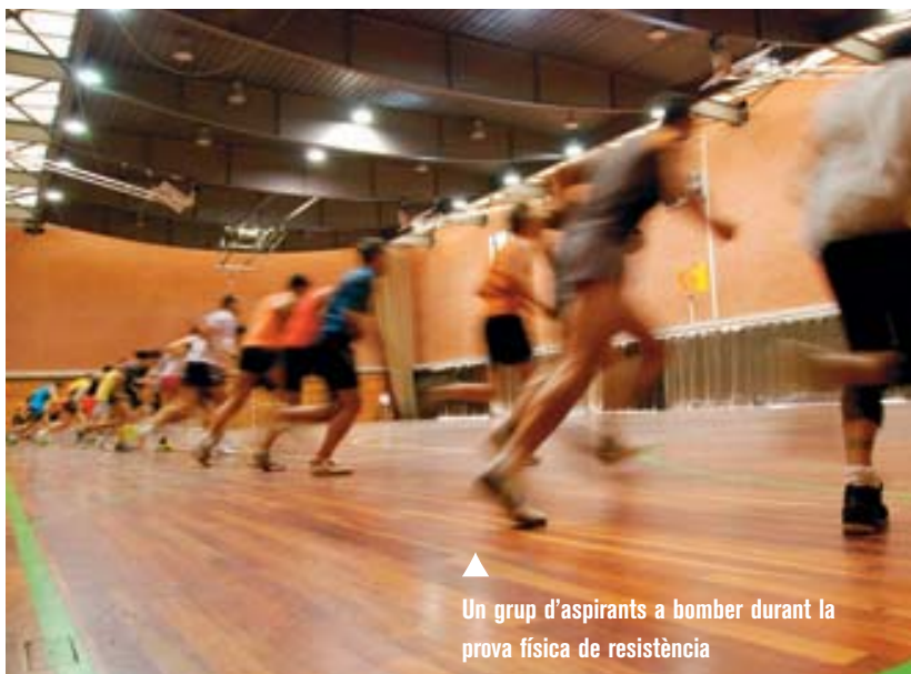
▲ Un grup d'aspirants a bomber durant la prova física de resistència

Per territoris, l'Eixample, seguit de Sants-Montjuïc i de Sant Martí, van ser els districtes que van demandar un major nombre d'intervencions, mentre que Les Corts va ser el que menys. Els equips de l'SPEIS també es van desplaçar fora del terme municipal un total de 24 vegades, per col·laborar amb els serveis dels municipis veïns en rescats i extincions a les zones limítrofes. 🚒