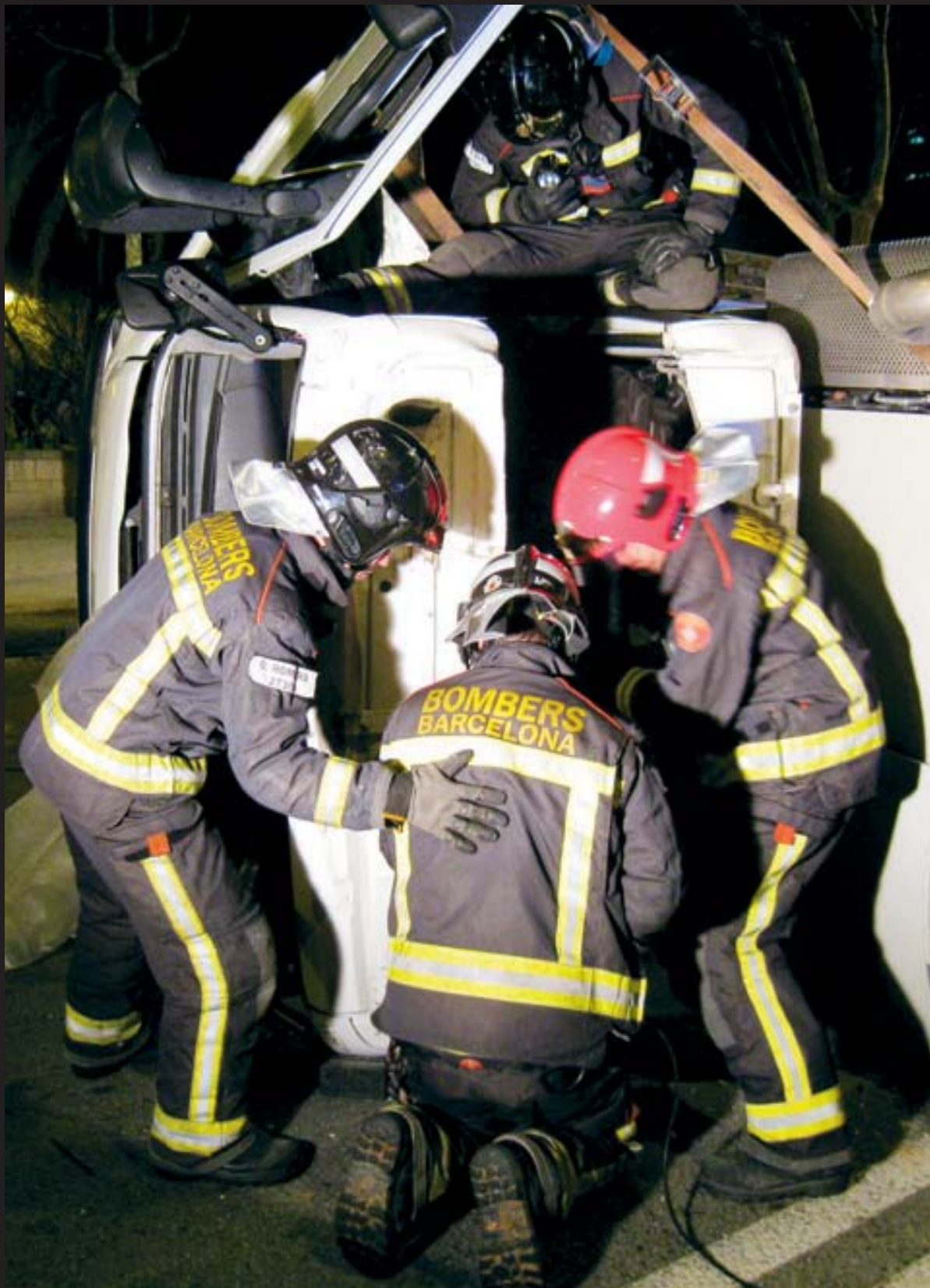
Quatre efectius de Bombers, durant els treballs d'excarceració del conductor d'un camió de BCNeta que havia quedat atrapat en bolcar lateralment el vehicle, el passat 30 de març.