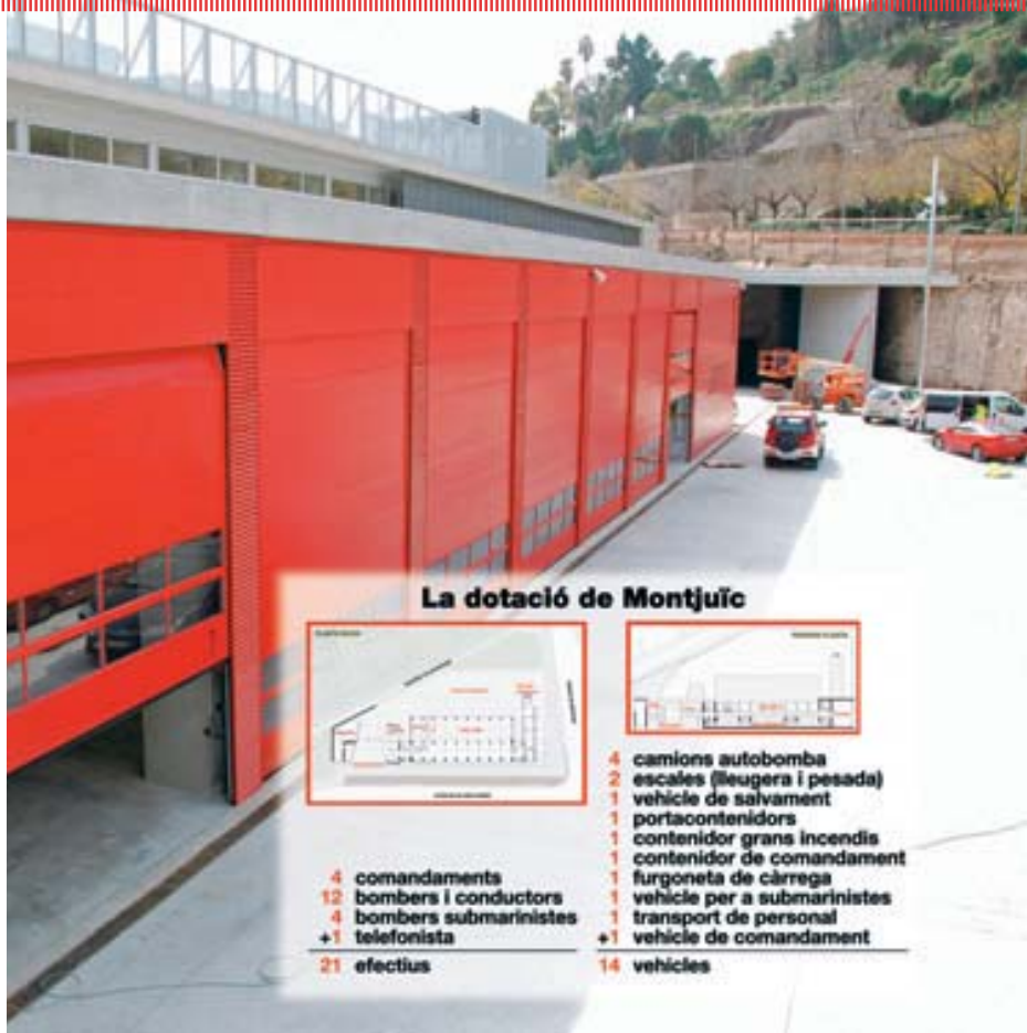
La dotació de Montjuïc

El projecte del Parc de Montjuïc ha estat elaborat per l'estudi d'arquitectes Ruisánchez, el mateix que va dissenyar el Parc de Llevant. Com el del carrer Castella, el nou parc és una instal·lació sostenible, amb finestrals per aprofitar al màxim la llum natural i una organització dels espais que prioritza l'eficàcia i la velocitat operativa. Enmig de la modernitat, però, també s'ha volgut deixar un espai a la tradició: com a colofó de les obres del nou parc, s'ha incorporat a la seva façana una reproducció en pedra de l'escut històric de Bombers de Barcelona. El mateix que hi havia al desaparegut Parc Central de l'Eixample. 🚒