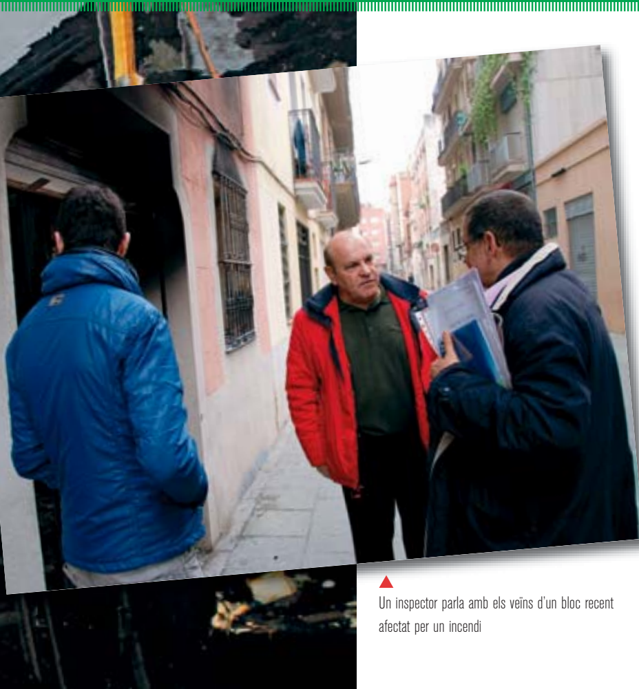
▲ Un inspector parla amb els veïns d'un bloc recent afectat per un incendi