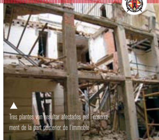
▲ Tres plantes van resultar afectades pel l'ensorrament de la part posterior de l'immoble

collapse, no es va haver de lamentar danys personals ja que els treballadors van sentir un soroll i van sortir ràpidament al carrer poc abans de produir-se l'esfondrament. Bombers va desplaçar-hi dues dotacions per realitzar un reconeixement exhaustiu de tota la finca i especialment del perímetre afectat. La superfície col·lapsada corresponia a uns 210 m 2 repartits