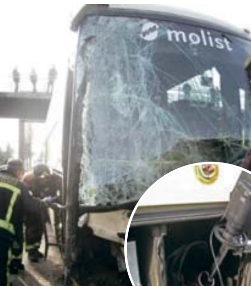
▲ Els efectius van haver de transvasar el gasoil de l'autocar, que patia una fuga