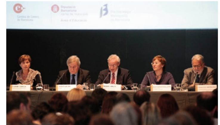
Presentació de l'informe a la Llotja de Mar (22 d'octubre)

Si voleu més informació d'aquest informe, podeu consultar el web de la Fundació BCN Formació Professional www.fundaciobcnfp.cat .