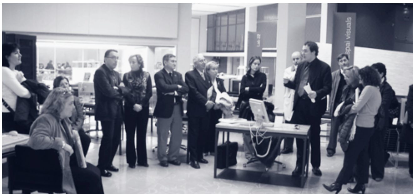
Visita a les instal·lacions de Barcelona Activa (1 de març del 2006)

programes d'ocupació, innovació, formació i assessorament que s'estan portant a terme actualment. A continuació, els assistents van visitar dues de les propostes més importants de Barcelona Activa: l'edifici del Viver d'Empreses i l'espai Porta22, dedicat a la informació i orientació sobre les ocupacions de futur. La visita va finalitzar amb un dinar de treball.