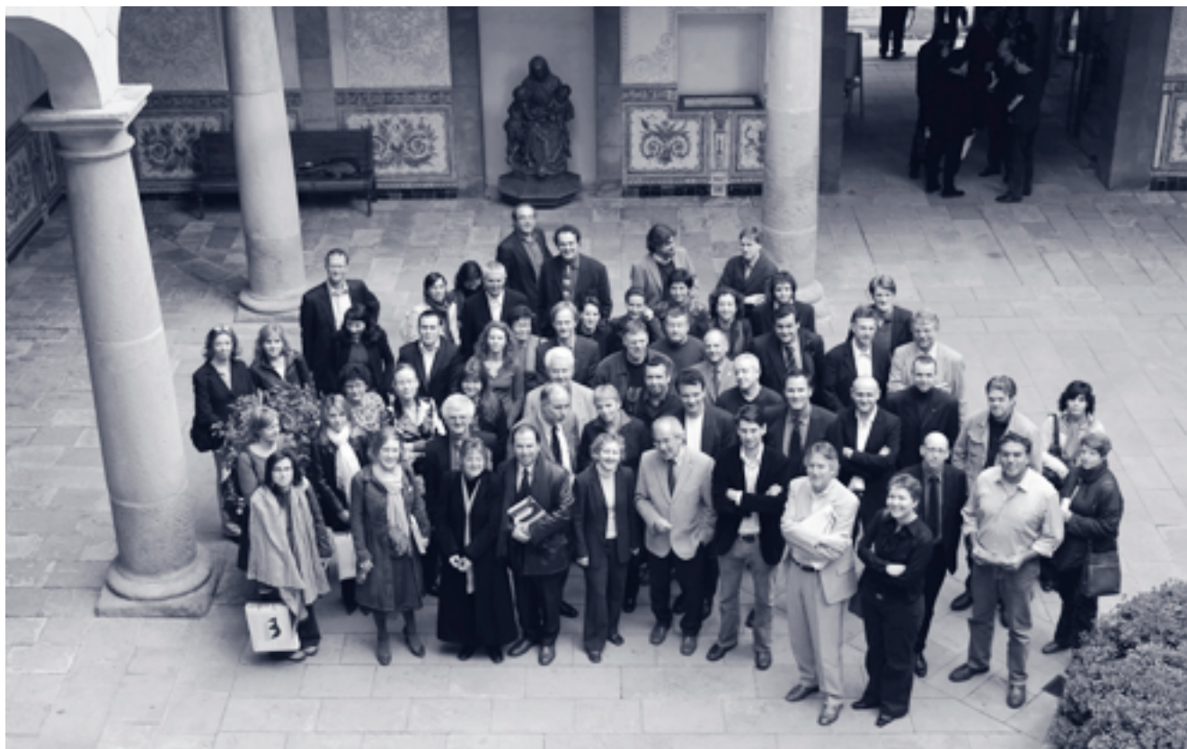
Jornades sobre Indústries Creatives (15-17 març, pati Manning, Centre d'Estudis i Recursos Culturals de la Diputació de Barcelona)

Per a més informació sobre la jornada i els materials de treball podeu accedir a les adreces web següents: www.bcn2000.es i www.compete-eu.org .