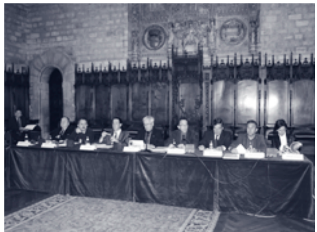
VII Consell General del PEMB, 24 d'abril de 2006, Saló de Cent de l'Ajuntament de Barcelona

En aquesta reunió també es van tractar i aprovar aspectes estatutaris, previstos en l'Associació, com és el tancament pressupostari de l'exercici anterior i el pressupost de l'Associació per a l'exercici del 2006. Així mateix, el president de la Comissió Delegada va presentar els temes claus que configuren el pla de treball de l'Associació per aquest any 2006.