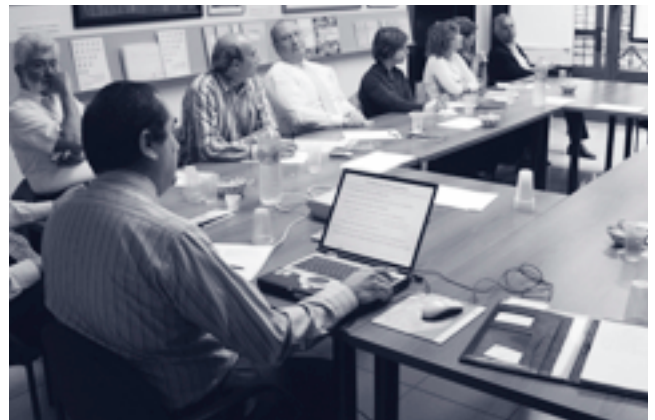
Seminari de la mobilitat (8 de maig, seu del PEMB)