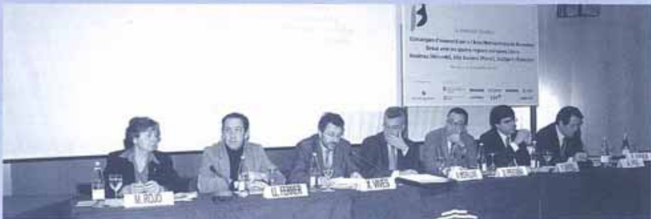
Tercera Jornada Tècnica. 15 de desembre, World Trade Center Barcelona

L'AMB té organitzacions molt bones i actives per al desenvolupament econòmic, és una de les àrees més atractives del món, té projectes a gran escala, sectors industrials creatius i forts, incubadores i parcs científics així com un perfil d'identitat i de competència. Cal reforçar el capital privat per a noves empreses i PIMES,