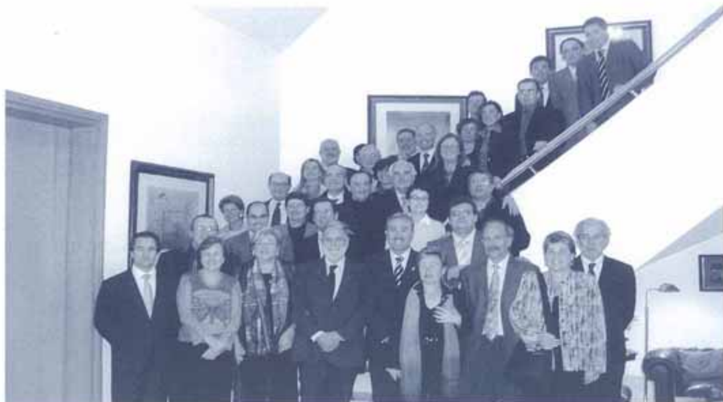
Recepció a l'ambaixada d'Espanya a Polònia

sultoria. En aquesta trobada es van analitzar les oportunitats de Polònia pel que fa a la inversió d'empreses de Catalunya, així com les dificultats que encara comporta la concreció, fruit d'un mercat encara en fase de normalització, tot i que amb unes elevades expectatives de creixement.