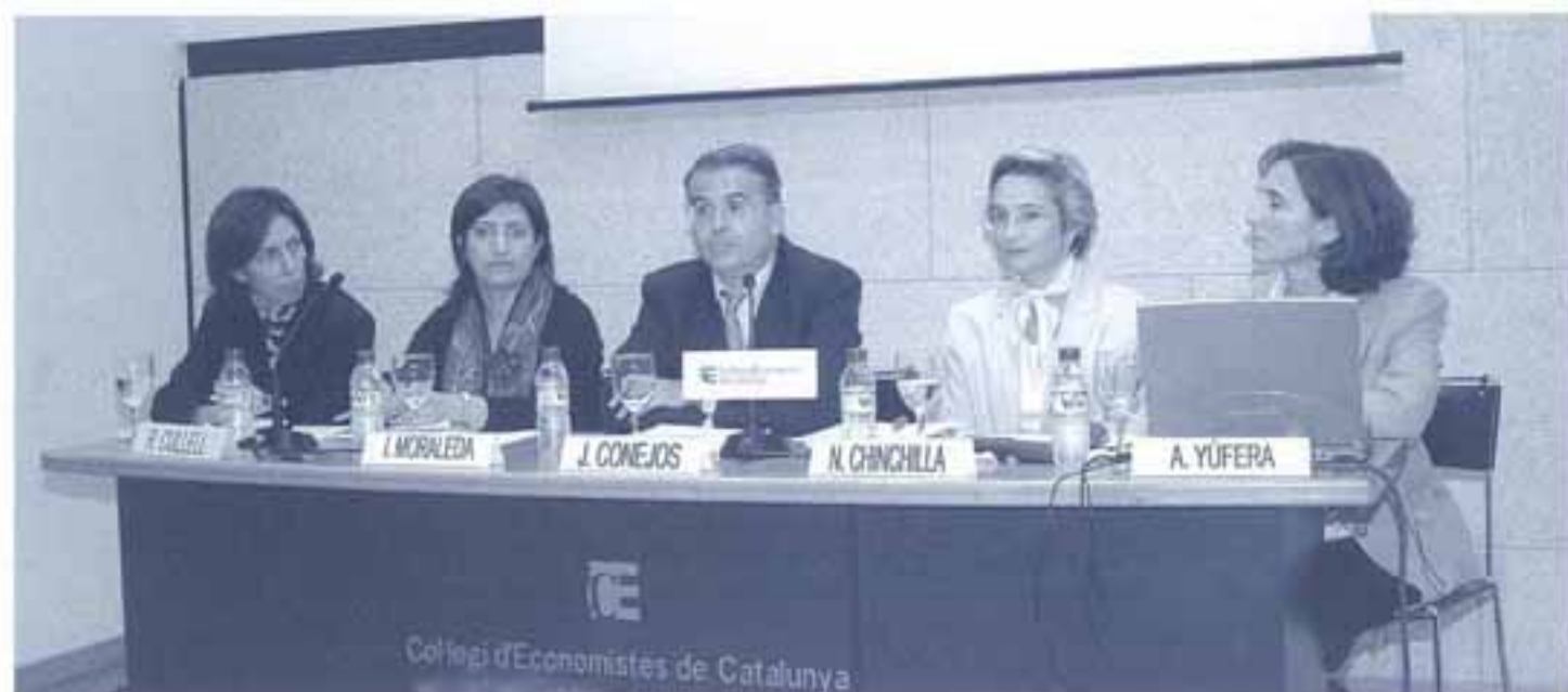
Presentació al Col·legi d'Economistes de Catalunya