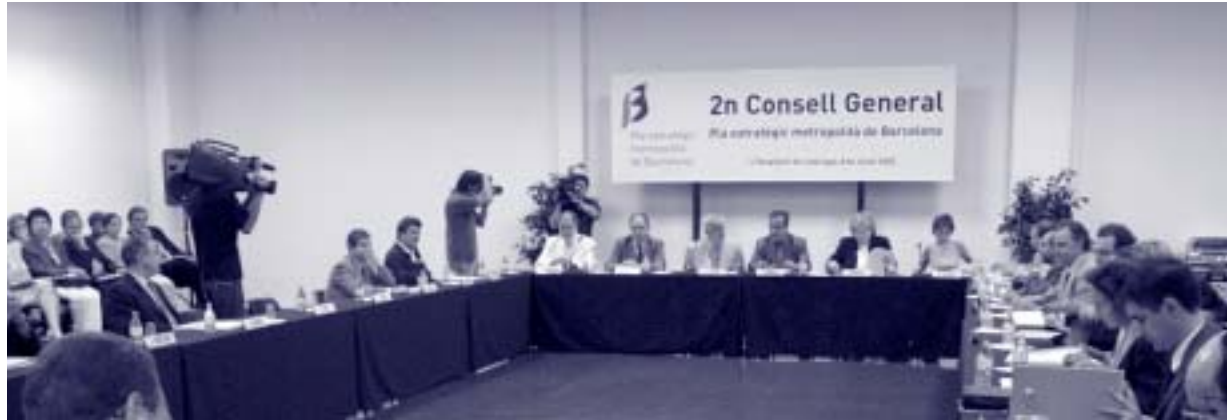
Tot i la massiva assistència, la reunió va configurar una veritable sessió de treball