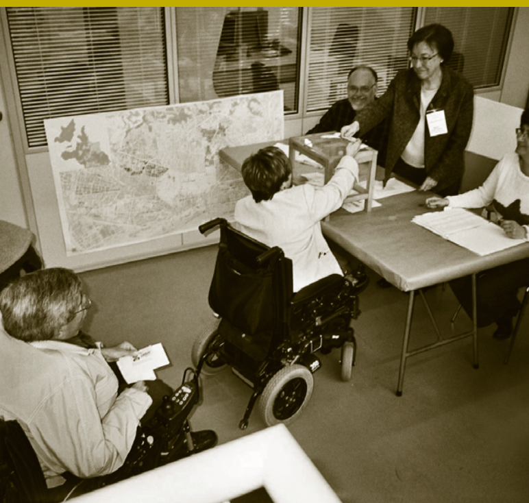
Jornada de votacions, seu de l'IMD, 17 de març.