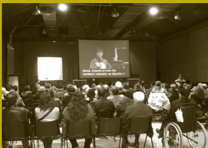
Sessió informativa sector discapacitats físiques, Cotxeres de Sants, 26 de febrer

Per a més informació, podeu contactar amb l'Institut Municipal de Persones amb Discapacitat Av. Diagonal, 233 – 08013 Barcelona Tel. 93 413 27 75 – Fax 93 413 28 00