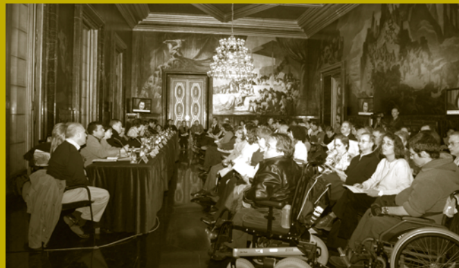
Presentació dels candidats i candidates, saló de Cròniques, 7 de febrer.

* Nombre de persones amb discapacitat registrades a l'IMD.