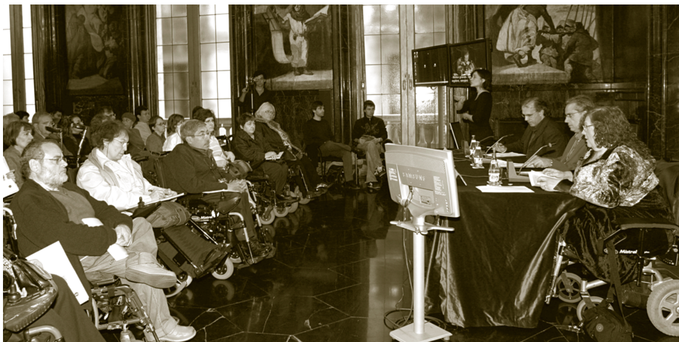
Fòrum del 30 de març. Saló de Cròniques de l'Ajuntament de Barcelona.

Així mateix, el 30 de març, l'Observatori Social de Barcelona va organitzar un fòrum sobre aquesta temàtica. Hi van participar diferents experts, els quals van fer-hi aportacions sobre com es pot compensar el greuge en els àmbits següents: les pensions i les rendes mínimes, els impostos i els beneficis fiscals i les prestacions i els serveis.