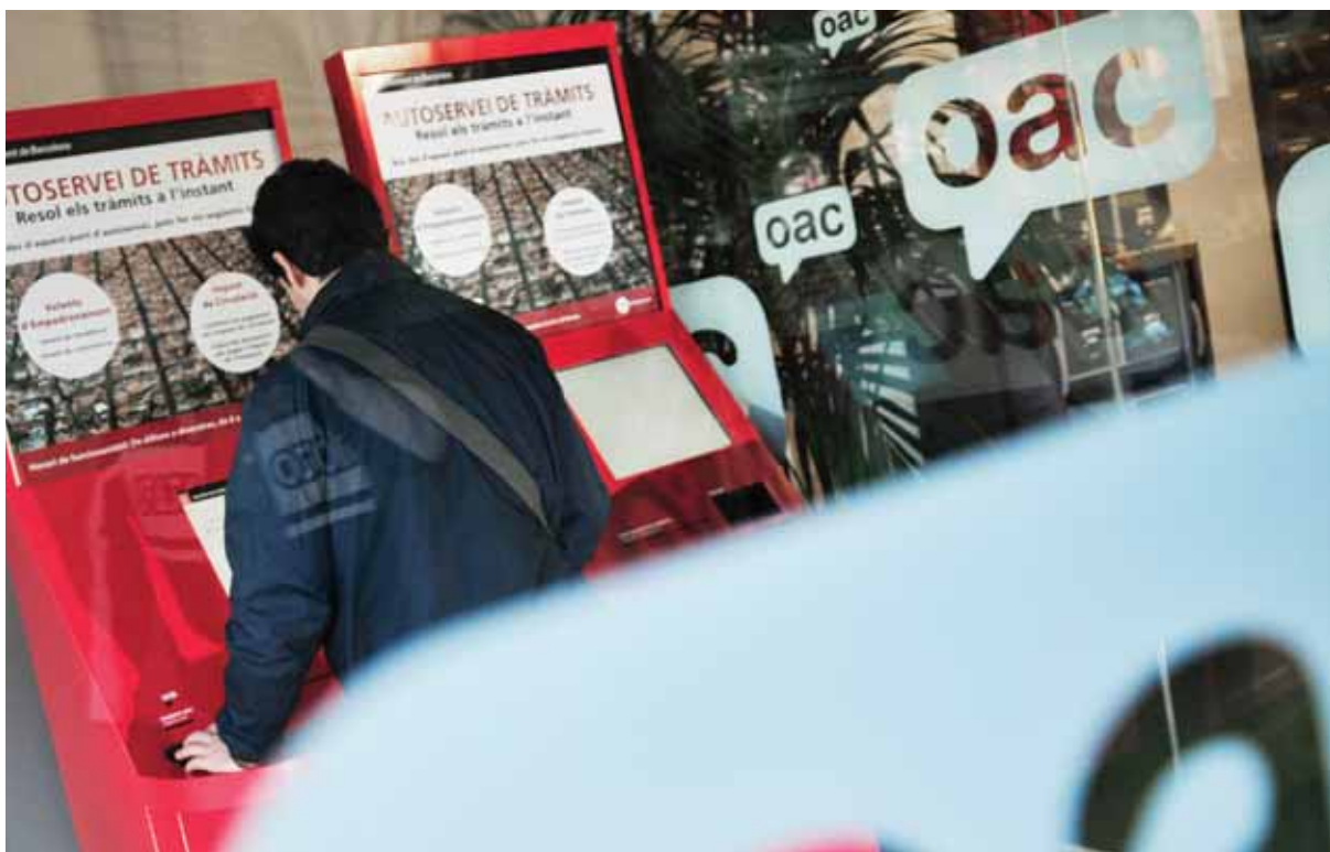
Un dels caixers d'informació i tràmits, ja en marxa

Caixer pilot d'informació i tràmits. El maig del 2007 es va posar en marxa un caixer pilot d'informació i tràmits a l'Oficina d'Atenció al Ciutadà del districte de l'Eixample. La valoració dels ciutadans ha estat positiva, així que el 2009 es posaran en marxa 44 caixers de tràmits més per tota la ciutat. Els caixers, que entre molts altres tràmits permeten que el ciutadà faci en règim d'autoservei gestions de població i hisenda, compten amb el lideratge del Departament d'Atenció al Ciutadà, que en aquest proper pla d'expansió tindrà l'ajut de l'Institut Municipal d'Informàtica i de l'Institut de Cultura, ja que en aquests caixers també es dona informació i es venen entrades d'esdeveniments culturals. ●