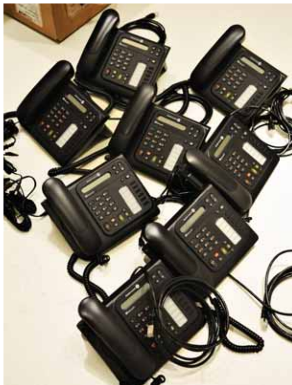
Millora de les prestacions de la nostra xarxa

El passat novembre va entrar en marxa la Central d'Urgències i Emergències Socials de Barcelona, que passa a integrar dos serveis que fins llavors funcionaven de forma separada. Es tracta del servei d'urgències socials, atenció les 24 hores del dia els 365 dies de l'any, i del servei d'emergències socials, que es posa en marxa per afrontar situacions de catàstrofe i risc col·lectiu. S'han posat en comú els recursos dels dos serveis perquè donin una millor resposta als ciutadans que els necessitin. ●