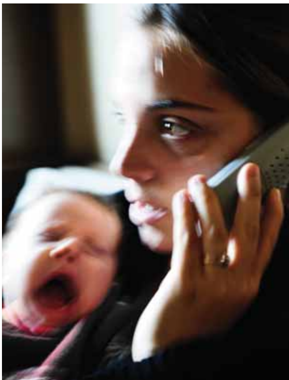
Nous serveis per afrontar situacions d'emergència