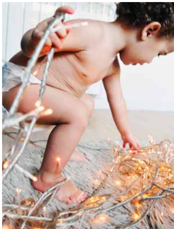
Donem suport al comerç millorant la il·luminació nadalenca

Mercats provisionals a Sant Antoni. La reforma del mercat de Sant Antoni farà que es construeixin dos mercats provisionals, un al costat de l'altre, a la Ronda de Sant Antoni, en el tram entre els carrers Urgell i Floridablanca (aquest tram serà restringit al pas de vehicles). Aquests mercats acolliran els comerciants d'alimentació i els dels Encants. El mercat dominical mantindrà la seva ubicació exterior al voltant del mercat. Aquestes estructures tindran magatzems i espais per a la recollida selectiva de brossa. També disposaran de climatització i de tots els serveis necessaris per als clients i comerciants. ●