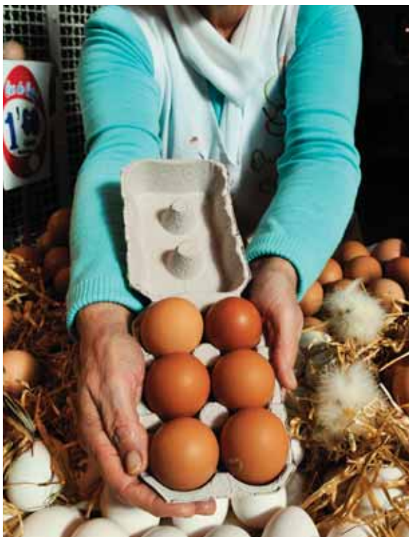
Nova carpa del mercat de Sant Antoni

Mercats provisionals a Sant Antoni. La reforma del mercat de Sant Antoni farà que es construeixin dos mercats provisionals, un al costat de l'altre, a la Ronda de Sant Antoni, en el tram entre els carrers Urgell i Floridablanca (aquest tram serà restringit al pas de vehicles). Aquests mercats acolliran els comerciants d'alimentació i els dels Encants. El mercat dominical mantindrà la seva ubicació exterior al voltant del mercat. Aquestes estructures tindran magatzems i espais per a la recollida selectiva de brossa. També disposaran de climatització i de tots els serveis necessaris per als clients i comerciants. ●