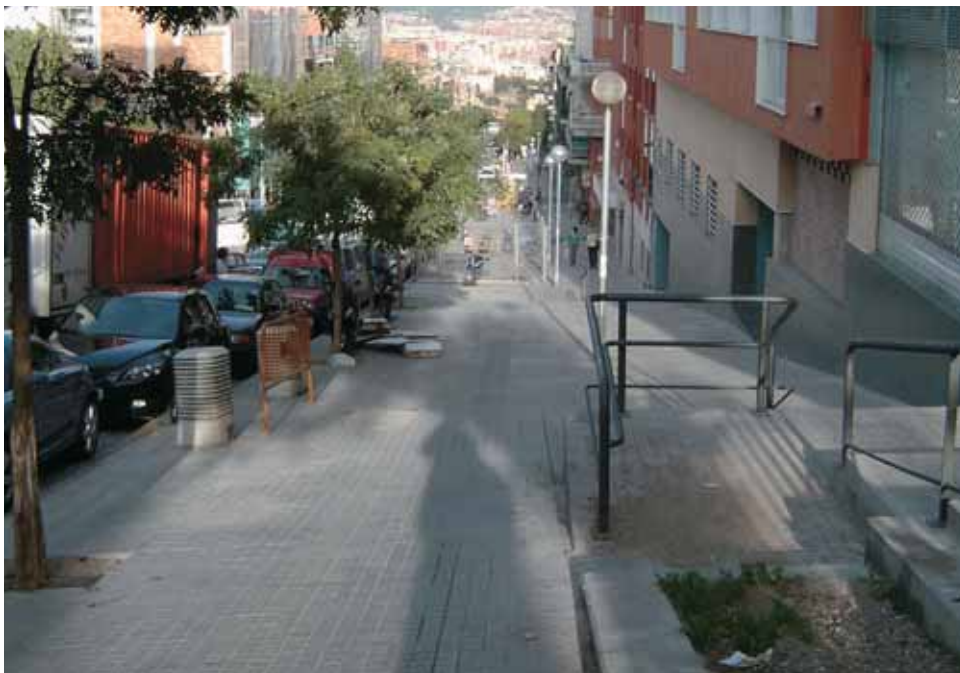
El carrer Llobregós era un dels eixos comercials i socials del barri del Carmel

Un any després, aquella relació continua. Els treballadors i treballadores del dispositiu d'emergència recorden el Carmel i els seus veïns i veïnes amb la sensació de la feina ben feta. Hem volgut recordar aquells dies des del punt de vista dels companys i companyes, que ens han fet arribar les seves reflexions al respecte. Sembla que el temps ofereix la imprescindible perspectiva, i es fa palès el fet que Barcelona es va bolcar en defensa dels seus barris.