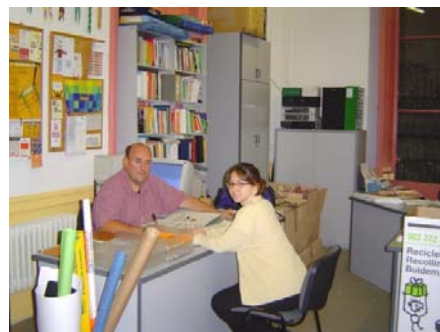
Acció Escolta va ser una de les entitats participants l'any 2005

Podeu sol·licitar més informació a la secretaria de l'Agenda 21 agenda21@bcn.cat