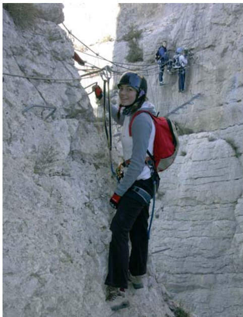
VIA FERRADA A OLIANA, 2005

L'exercici físic i l'esport, per les seves característiques (component lúdic, de relació amb el propi cos, de contacte amb el grup d'iguals, activitat d'oci i de diversió...), pot resultar