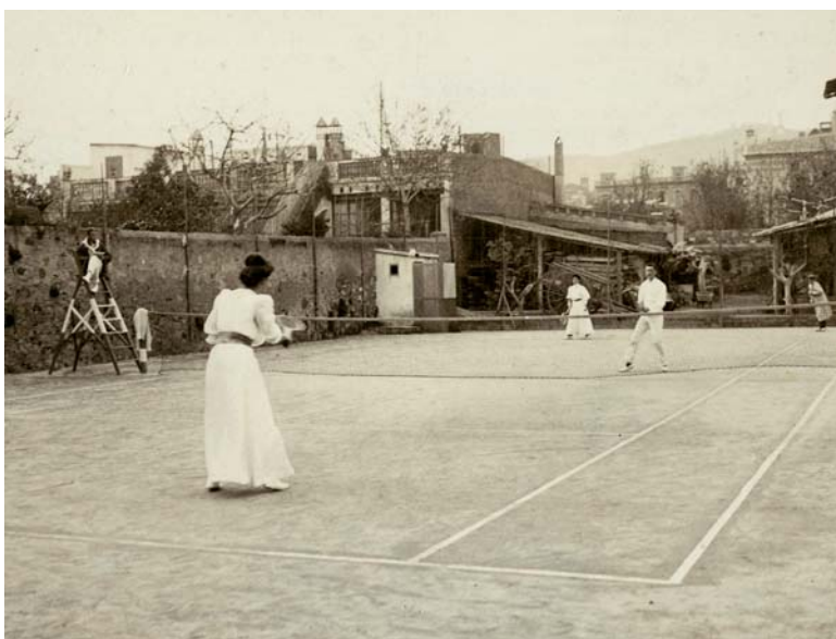
PARTIT DE TENNIS, Juny de 1907 Frederic Ballell Font: Arxiu Fotogràfic de la Ciutat.

No és gens agosarat afirmar, doncs, que durant aquests anys de la primera institucionalització esportiva el fet de ser dona esdevé un obstacle per a la pràctica pública de les activitats físiques. Si bé, com hem dit altres vegades 2 , es pot parlar de quatre grans elements de discriminació per a la pràctica esportiva a la Catalunya anterior a la Primera Guerra Mundial, com ara la durada de la jornada laboral entre les classes populars, la inexistència d'instal·lacions esportives de caràcter públic, la capacitat adquisitiva dels ciutadans i la distància cultural entre