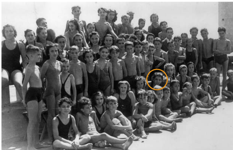
CURSET INFANTIL DEL CNB, estiu de 1941

Per això el futbol podia comparar-se amb la societat. Cadascú ha de fer la seva feina: si el porter fa el que li correspon, i ho fan els defenses, els mitjos i els davanters, l'equip funciona; si no, per molt bons que siguin els jugadors, l'equip fracassa. I en la societat passa exactament el mateix: si cada ciutadà fa amb responsabilitat la feina que li escau, la societat funcionarà i tirarà endavant; altrament, es produeix un desgavell. Per això el lema la feina ben feta tan