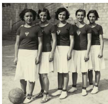
PARTIT FEMENÍ DE BÀSQUET, 28 d'octubre de 1934 Pérez de Rozas Font: Arxiu Fotogràfic de la Ciutat.