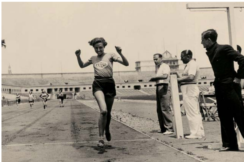
ATLETISME, 16 de juny de 1935 Pérez de Rozas Font: Arxiu Fotogràfic de la Ciutat.

En aquest sentit, pot ser interessant tenir en compte dos exemples significatius i un cas paradigmàtic. El primer exemple, relacionat amb la percepció pública del fet esportiu femení, es refereix a la pràctica atlètica de les dones barcelonines en l'escenari urbà. Entre 1925 i 1936, la dona esportista pren, per dir-ho amb una imatge simbòlica, els carrers de la ciutat, i ho fa tot participant en proves, competicions, trofeus i curses urbanes. El segon exemple es refereix a l'inici de l'accés de les dones en l'àmbit de la gestió de les entitats