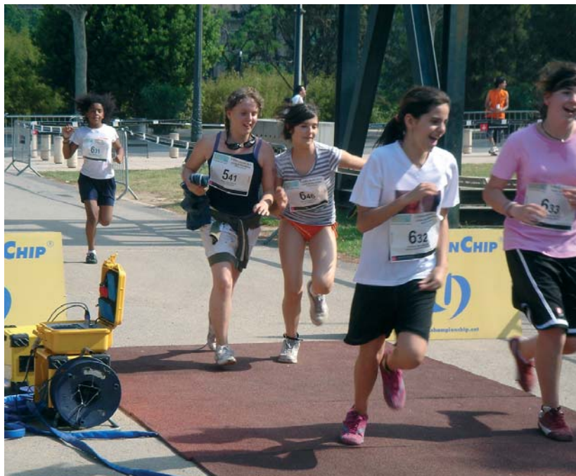
ARRIBADA DE LA BIATLÓ 6 de juny 2007

En aquest procés de selecció els pares hi poden tenir un paper important, però les seves possibilitats d'acció no es limiten tan sols al moment de la tria.