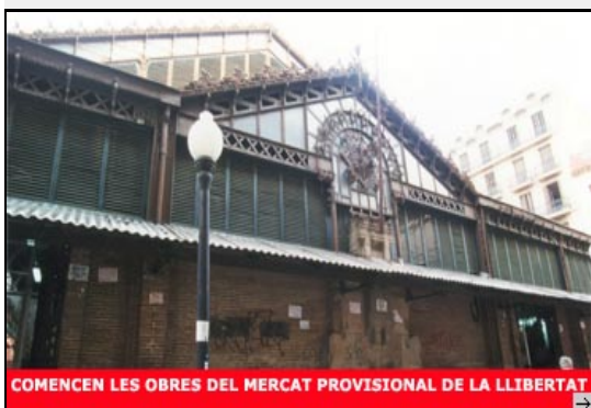
COMENCEN LES OBRES DEL MERCAT PROVISIONAL DE LA LLIBERTAT

La primera setmana d'agost començaran les obres de construcció del mercat provisional on es traslladaran els comerciants d'un dels mercats més emblemàtics de la ciutat: el Mercat de la Llibertat de Gràcia. L'equipament continuarà obert tot l'estiu mentre s'enllesteixen les obres del mercat provisional, que s'ubicarà a la plaça de Gal·la Placídia en sentit ascendent, a tocar del mercat actual.