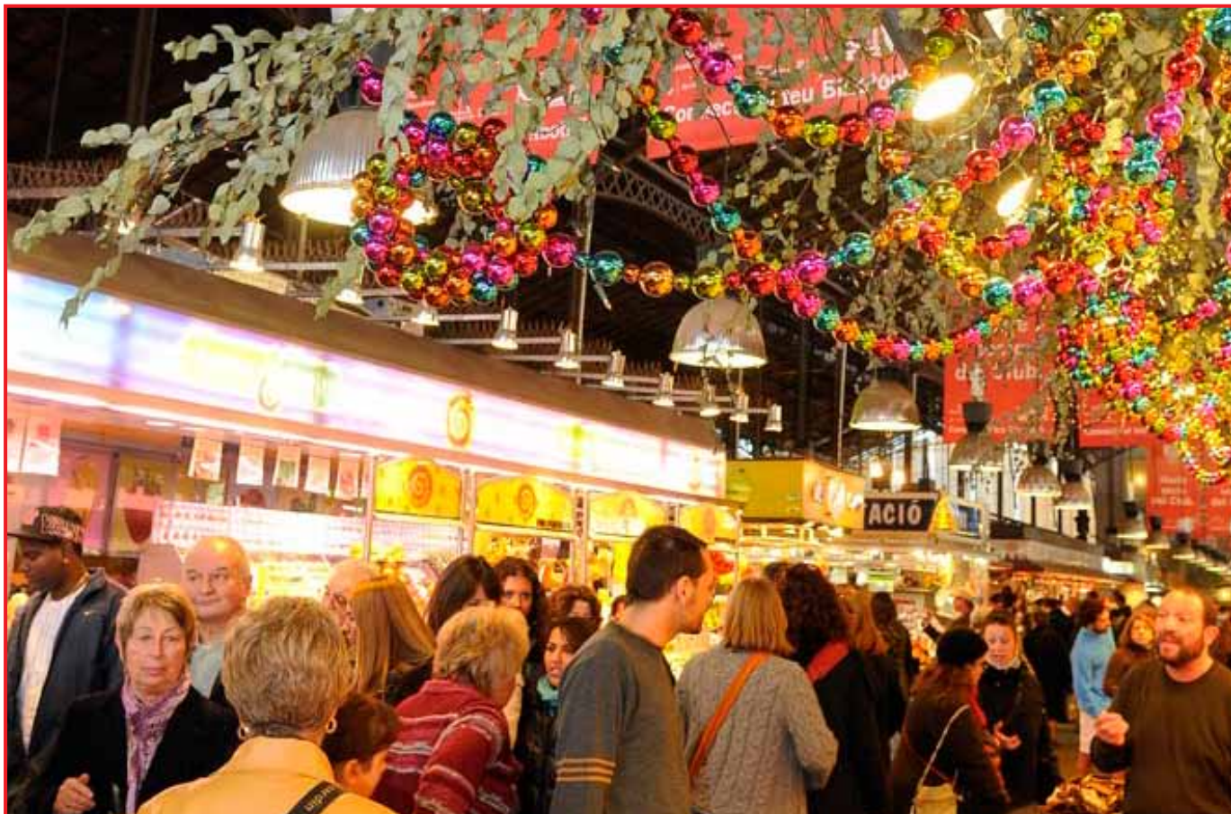
Decoració festiva al Mercat de La Boqueria

Enguany es preveu un augment de ventes en els mercats de la ciutat, ja que és més familiar i econòmic celebrar els àpats a casa amb productes de mercat.