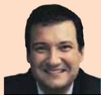
Jordi Hereu Alcalde de Barcelona